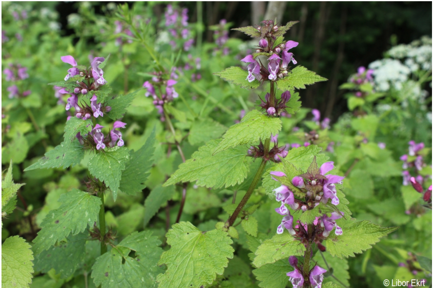
Lamium maculatum – Libor Ekrť – Černá v Pošumaví.