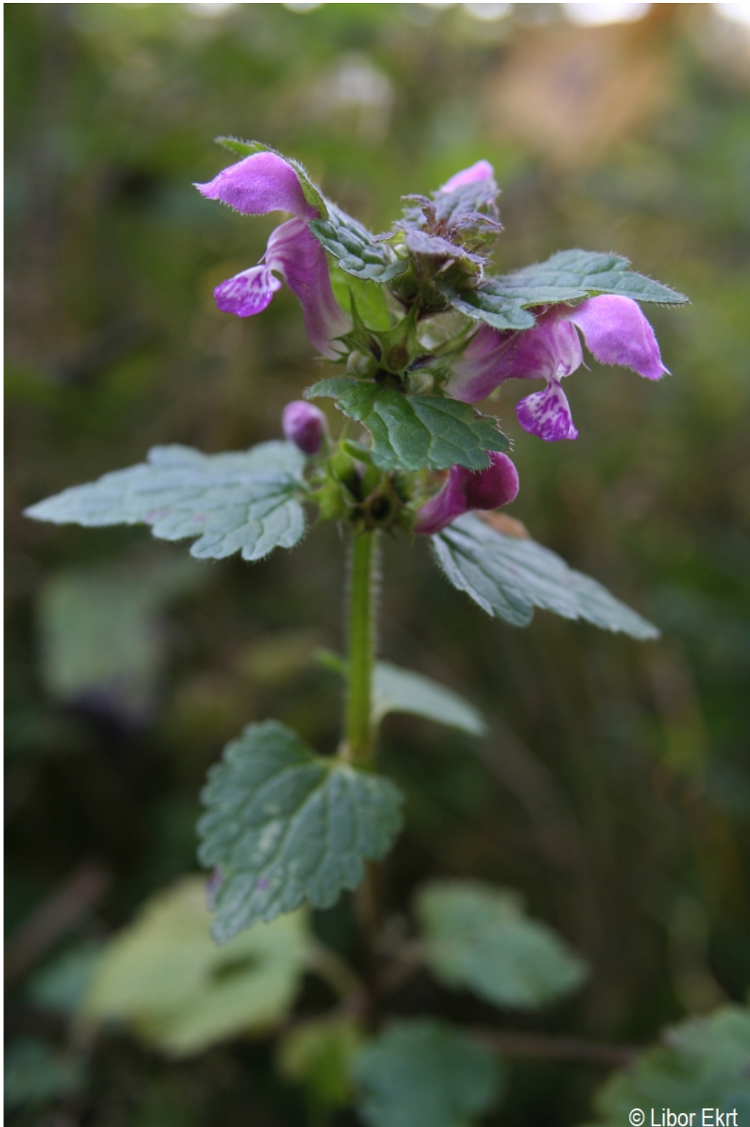
Lamium maculatum – Libor Ekrt – Strážný.