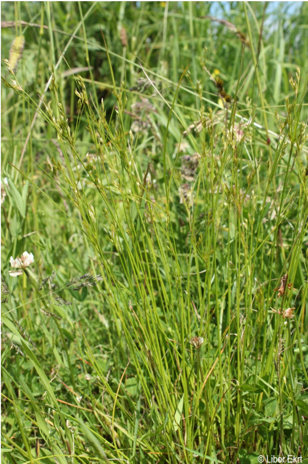
Juncus tenuis – Libor Ekrť – Pestrický vrch.