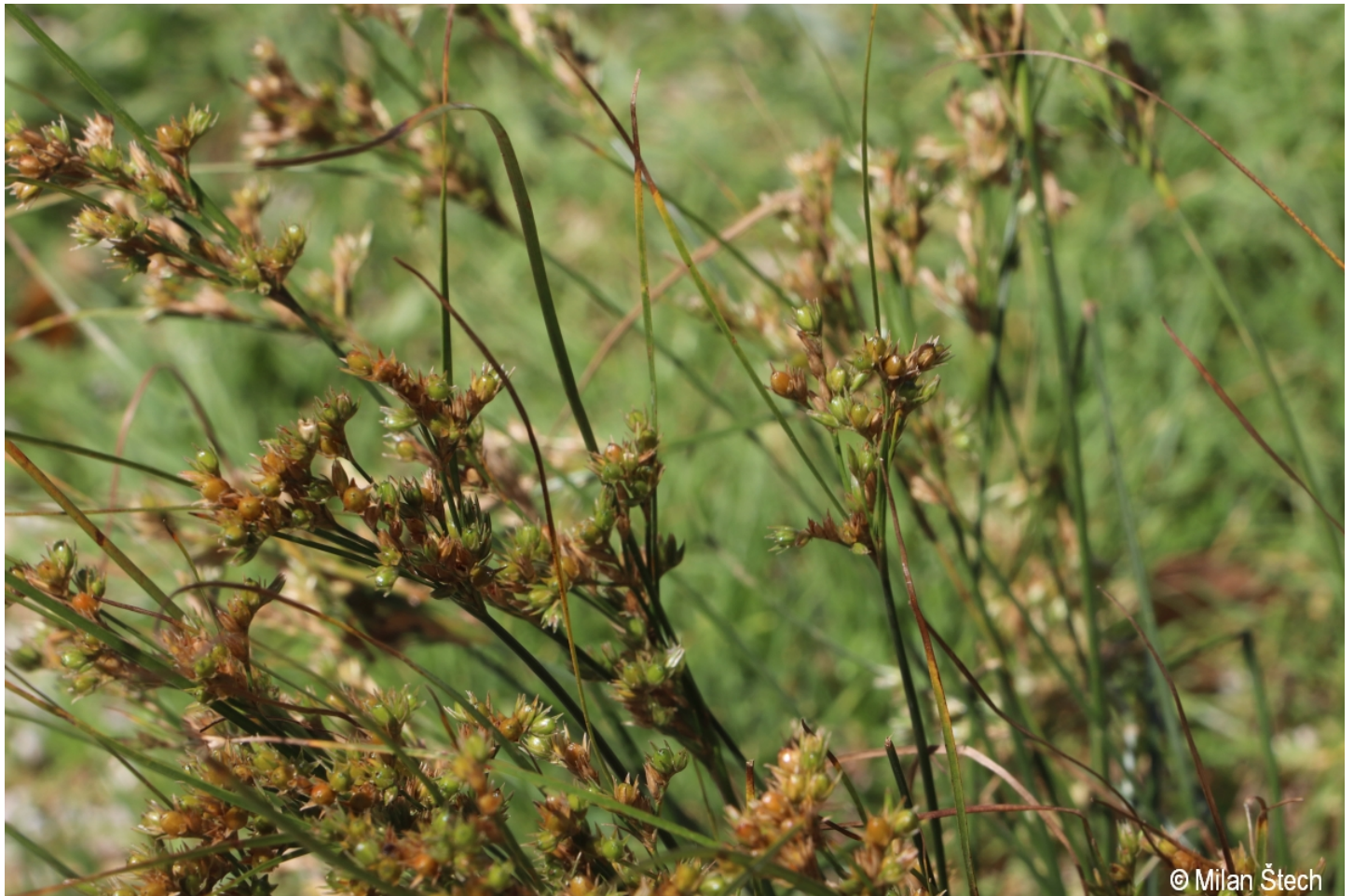
Juncus tenuis – Milan Štech – Svinná Lada.