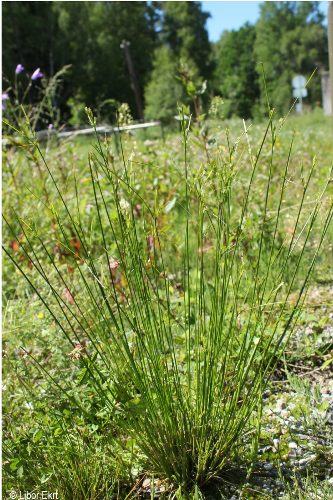
Juncus tenuis – Libor Ekrť – Hodňov.