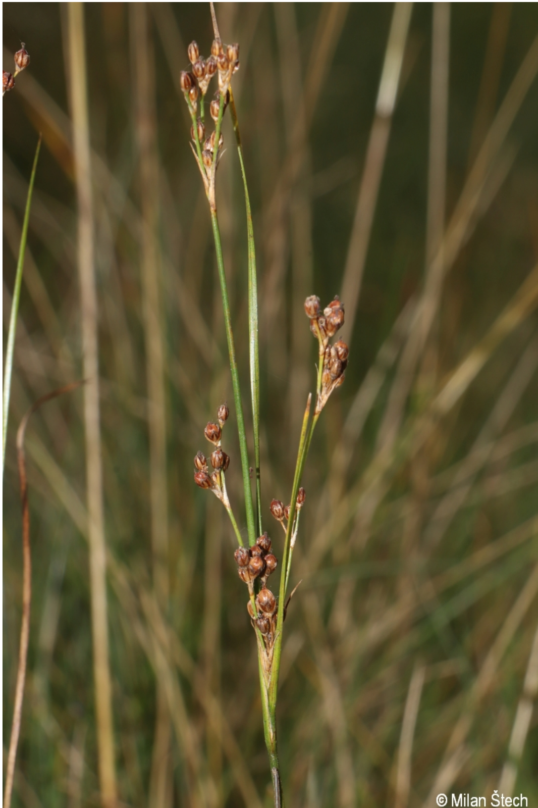
Juncus compressus – Milan Štech – Hindenburgkanzel.