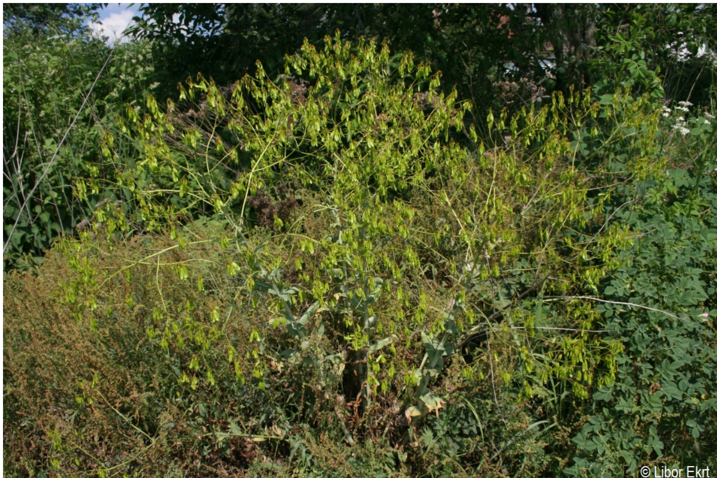
Isatis tinctoria – Libor Ekrť – Želňava, Slunečná.