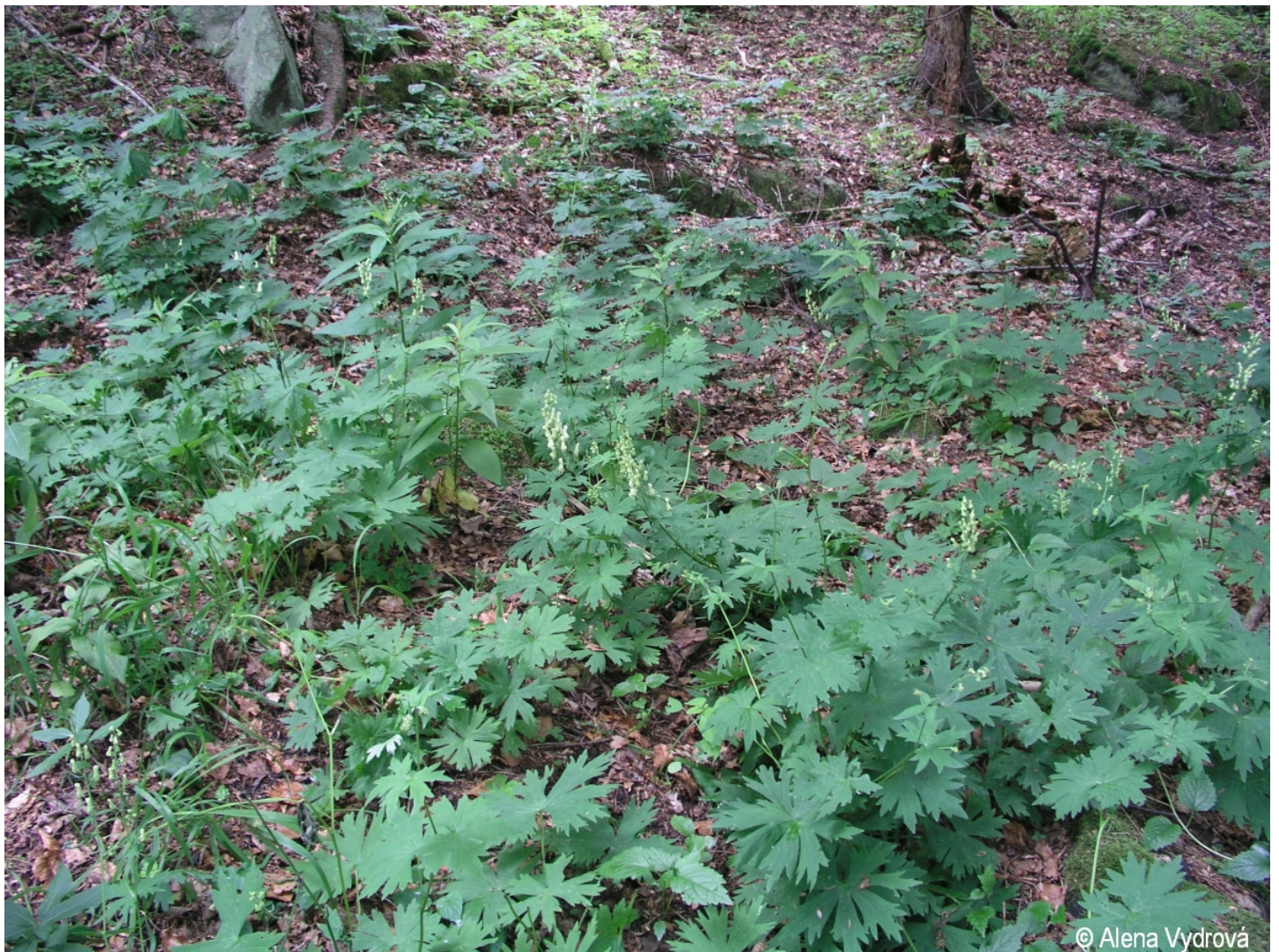
Aconitum lycoctonum – Alena Vydrová – Boletice.