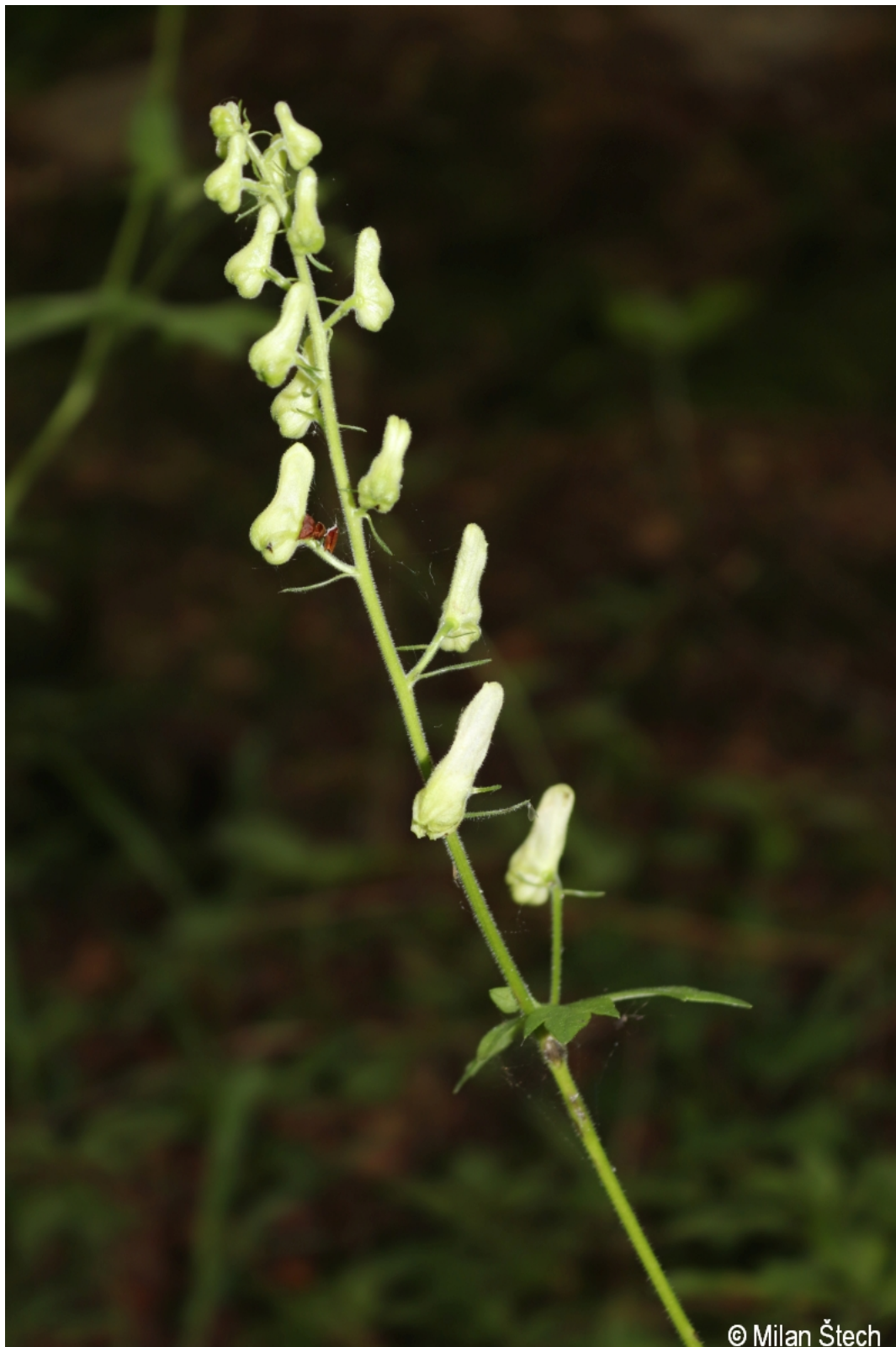
Aconitum lycoctonum – Milan Štech – Olšina, Suchý vrch.