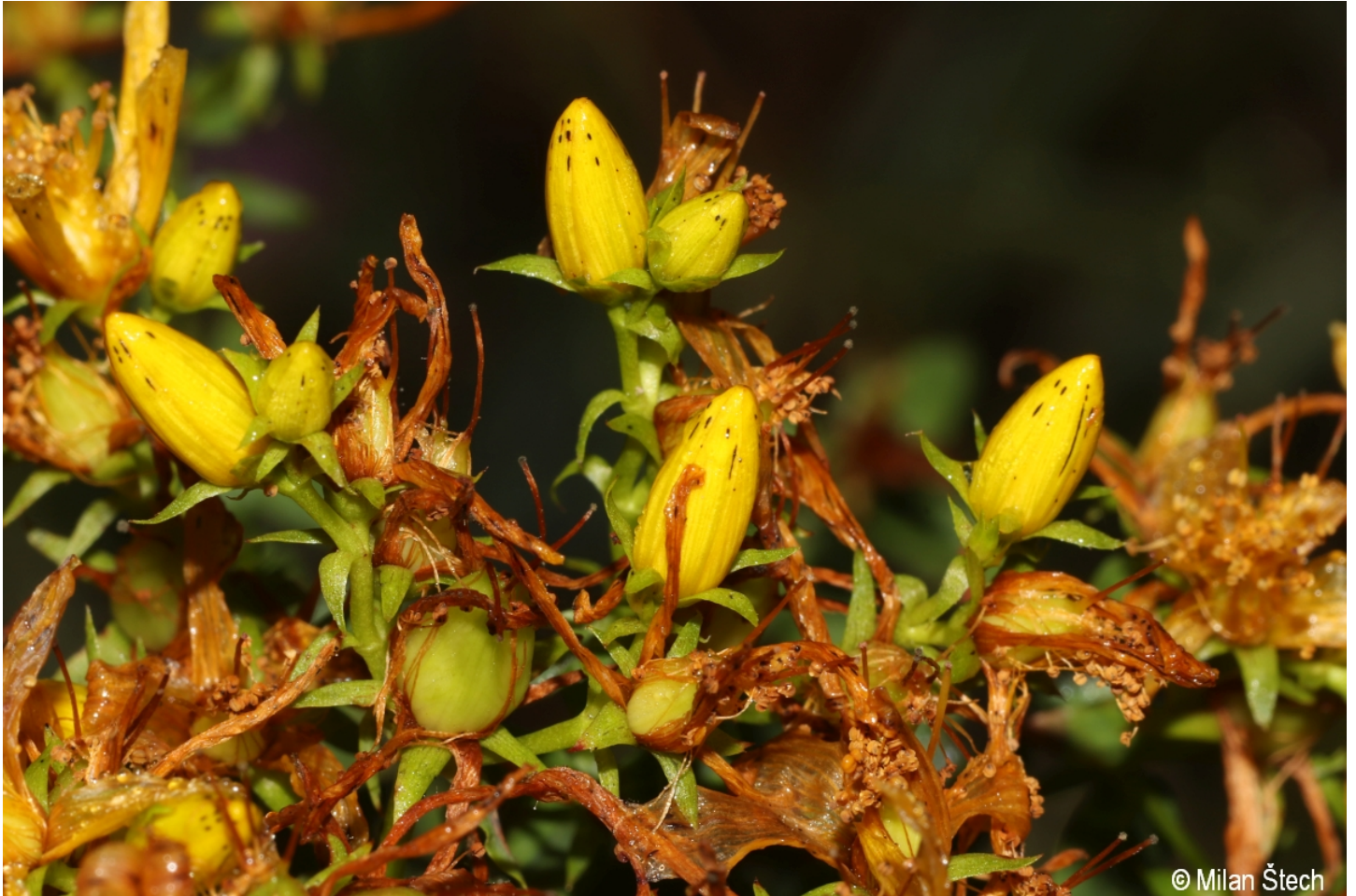
Hypericum perforatum – Milan Štech – Soumarský Most.