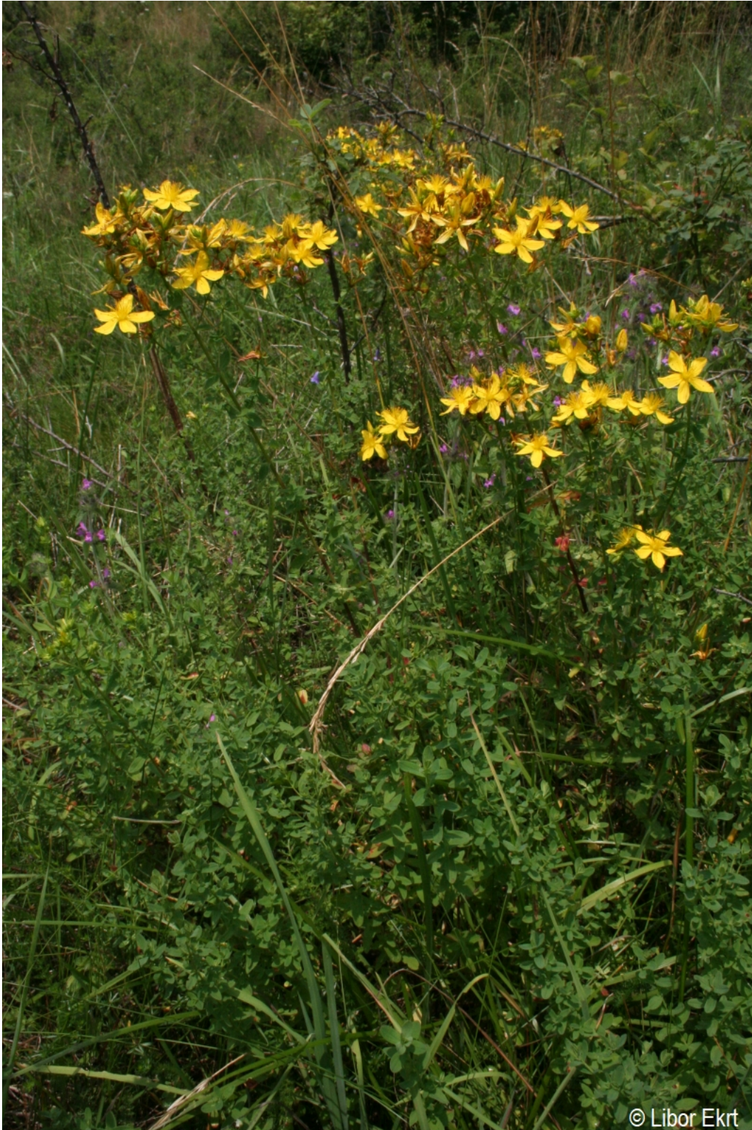
Hypericum perforatum – Libor Ekrt – Rejštejn.