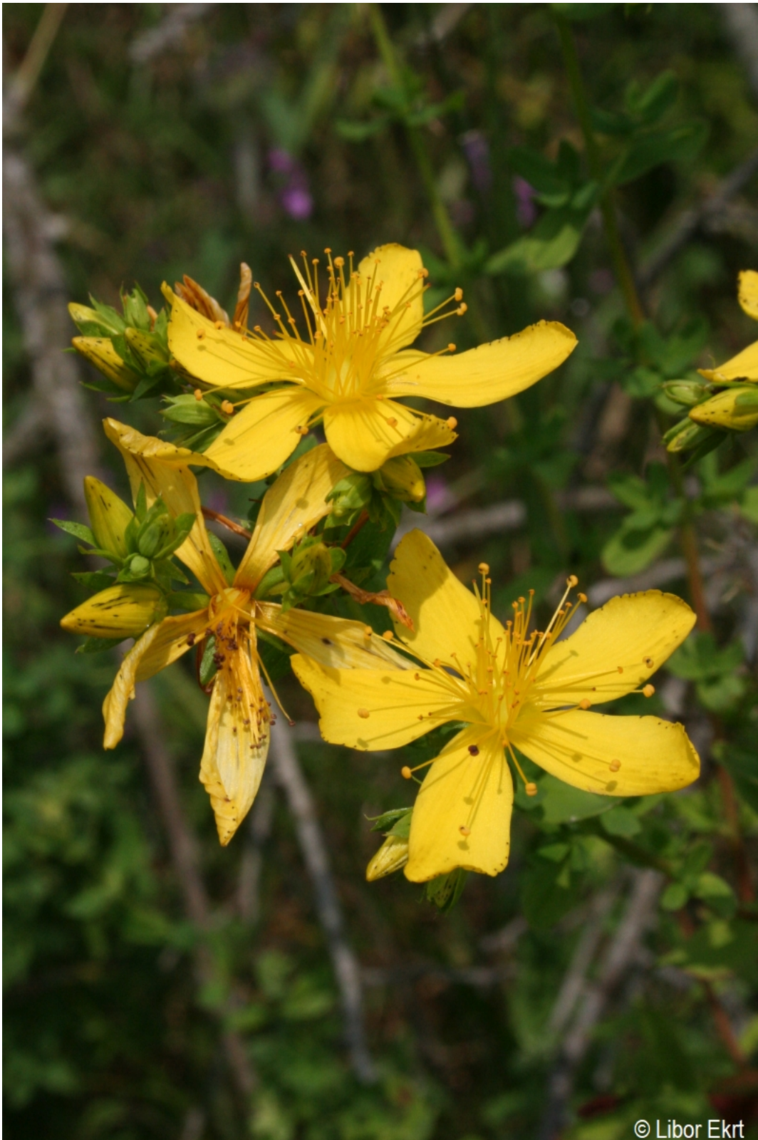
Hypericum perforatum – Libor Ekrť – Rejštejn.