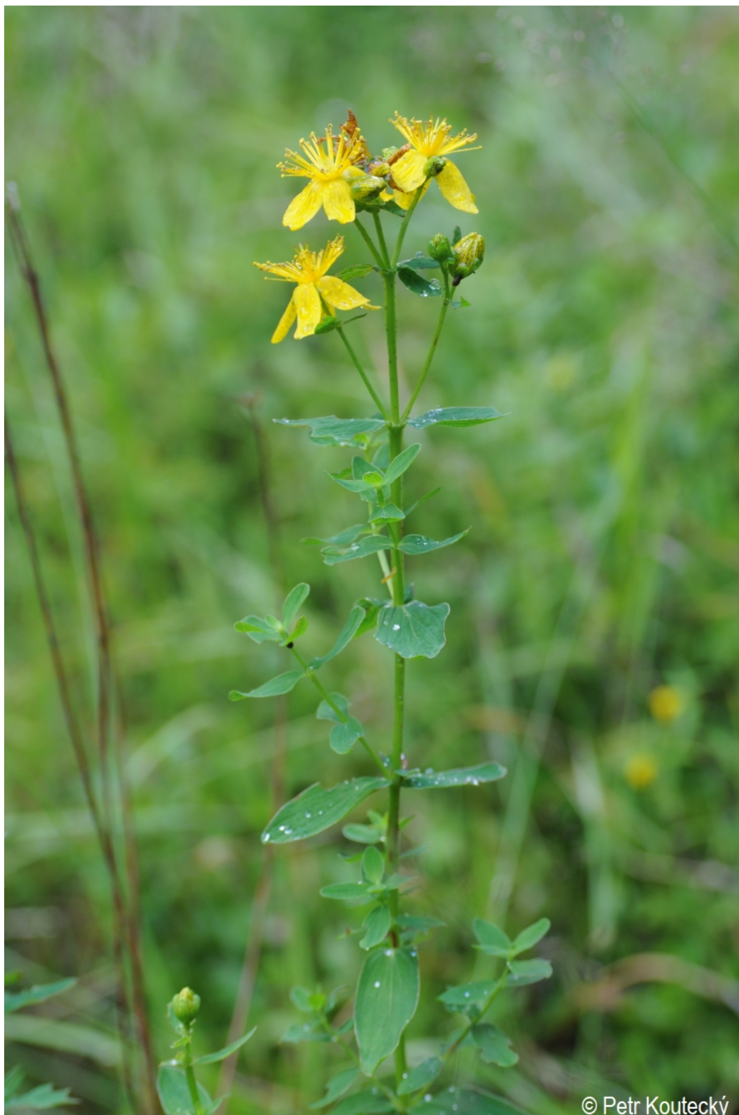
Hypericum maculatum – Petr Koutecký – Nová Hůrka, Hůrka.