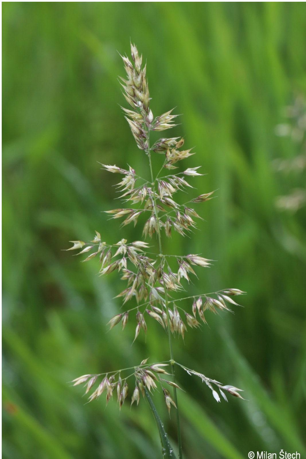
Holcus mollis – Milan Štech – Černá v Pošumaví.