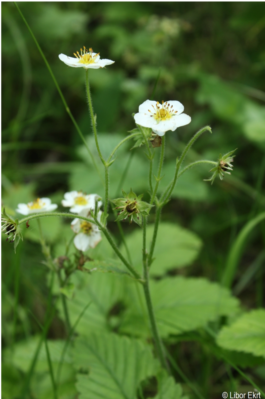
Fragaria moschata – Libor Ekrť – Hodňov.