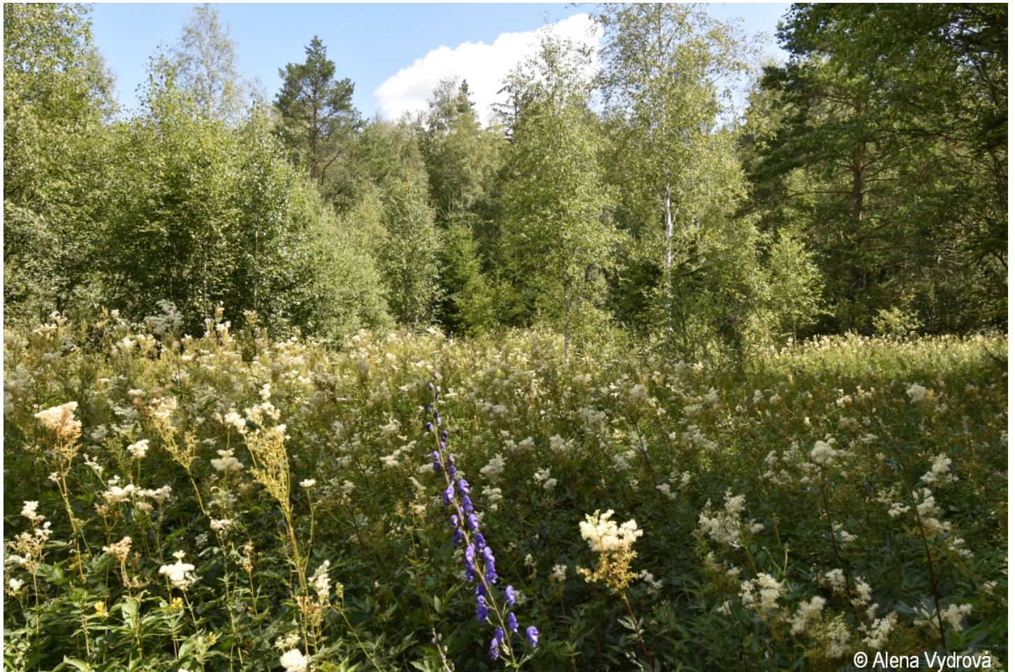
Filipendula ulmaria – Alena Vydrová – Olšina.