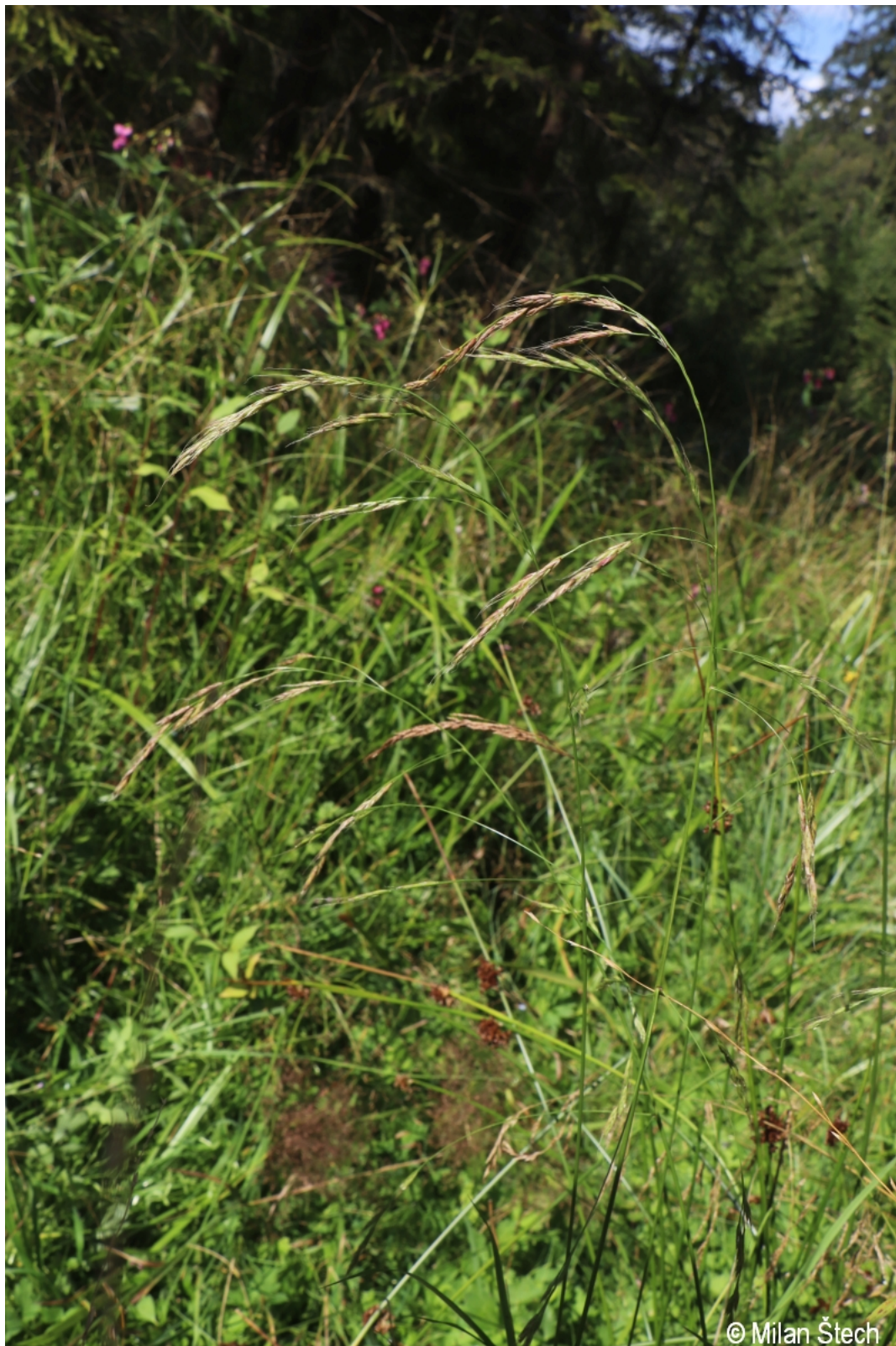
Festuca gigantea – Milan Štech – Altschönau.