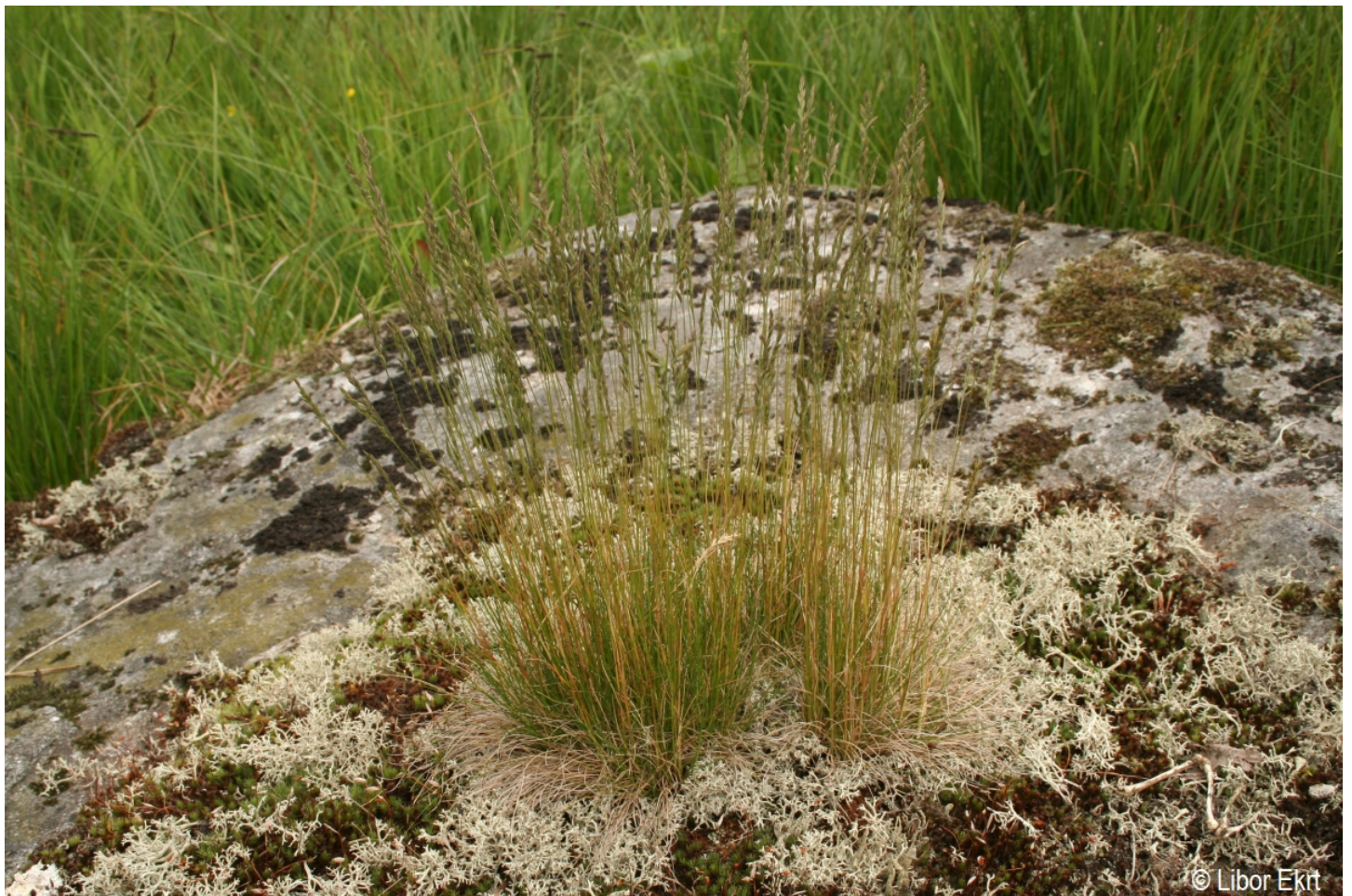
Festuca filiformis – Libor Ekrť – Pasecká slat'.