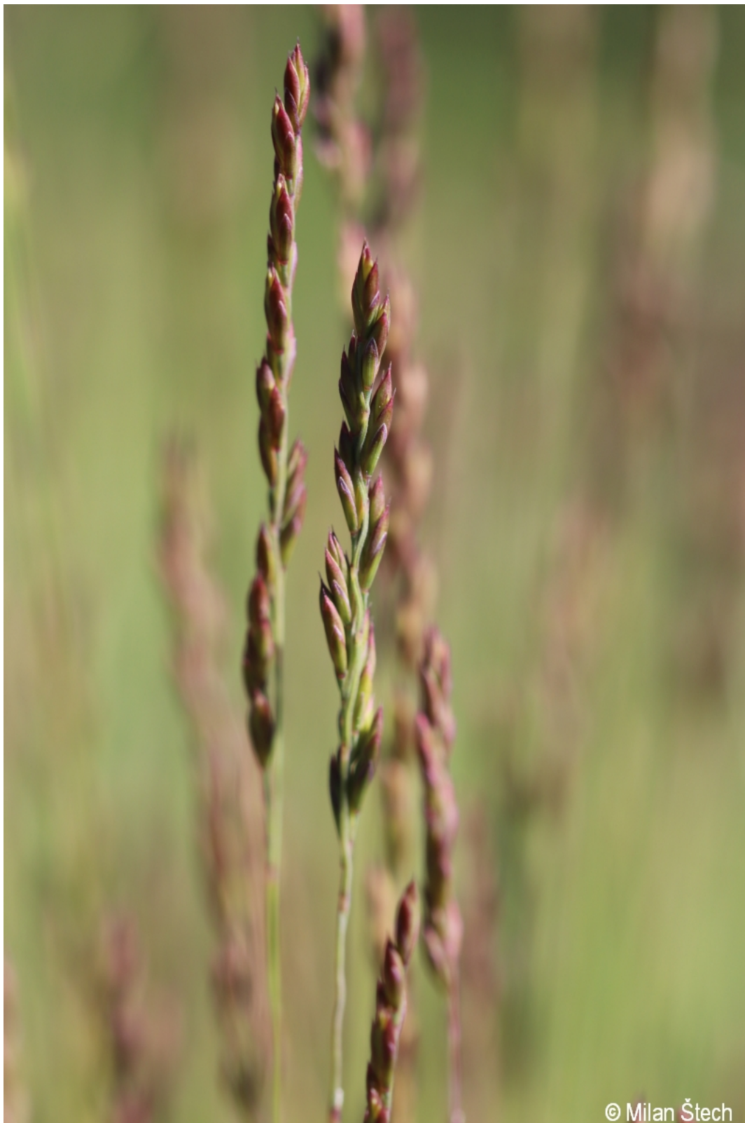
Festuca filiformis – Milan Štech – Kvilda.