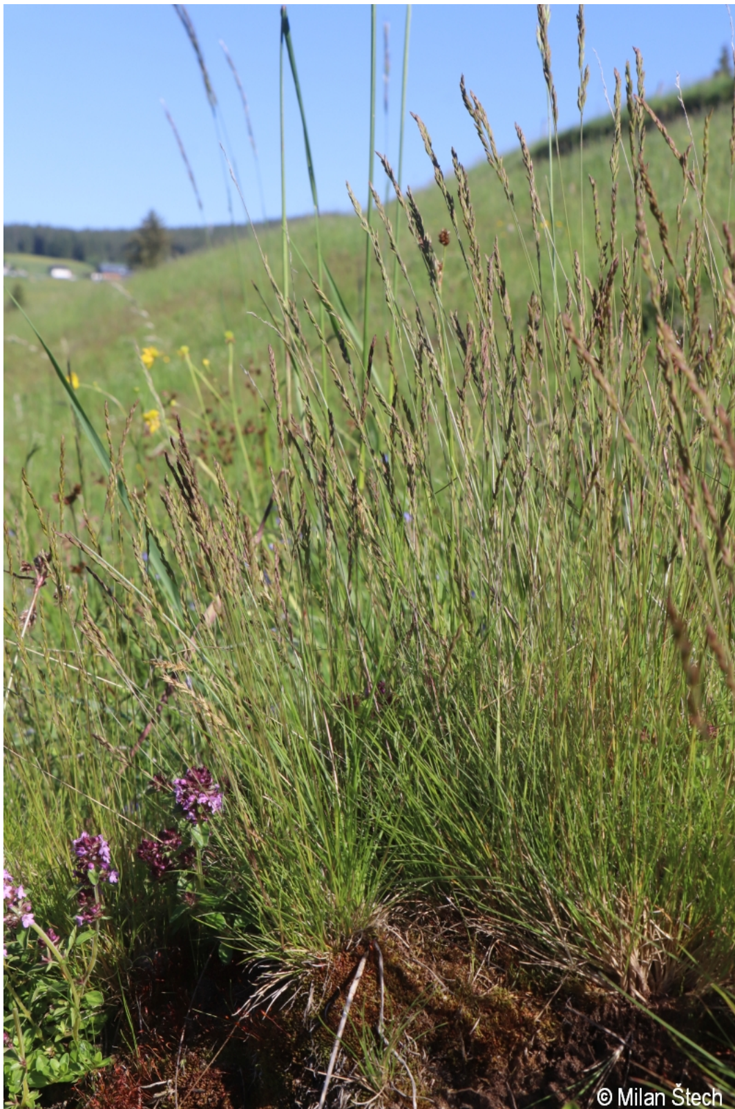
Festuca filiformis – Milan Štech – Kvilda.