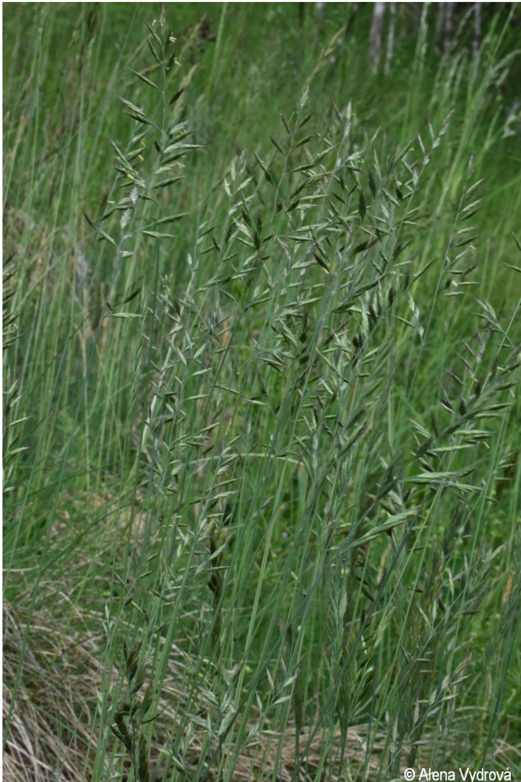
Festuca brevipila – Alena Vydrová – Soumarský Most.