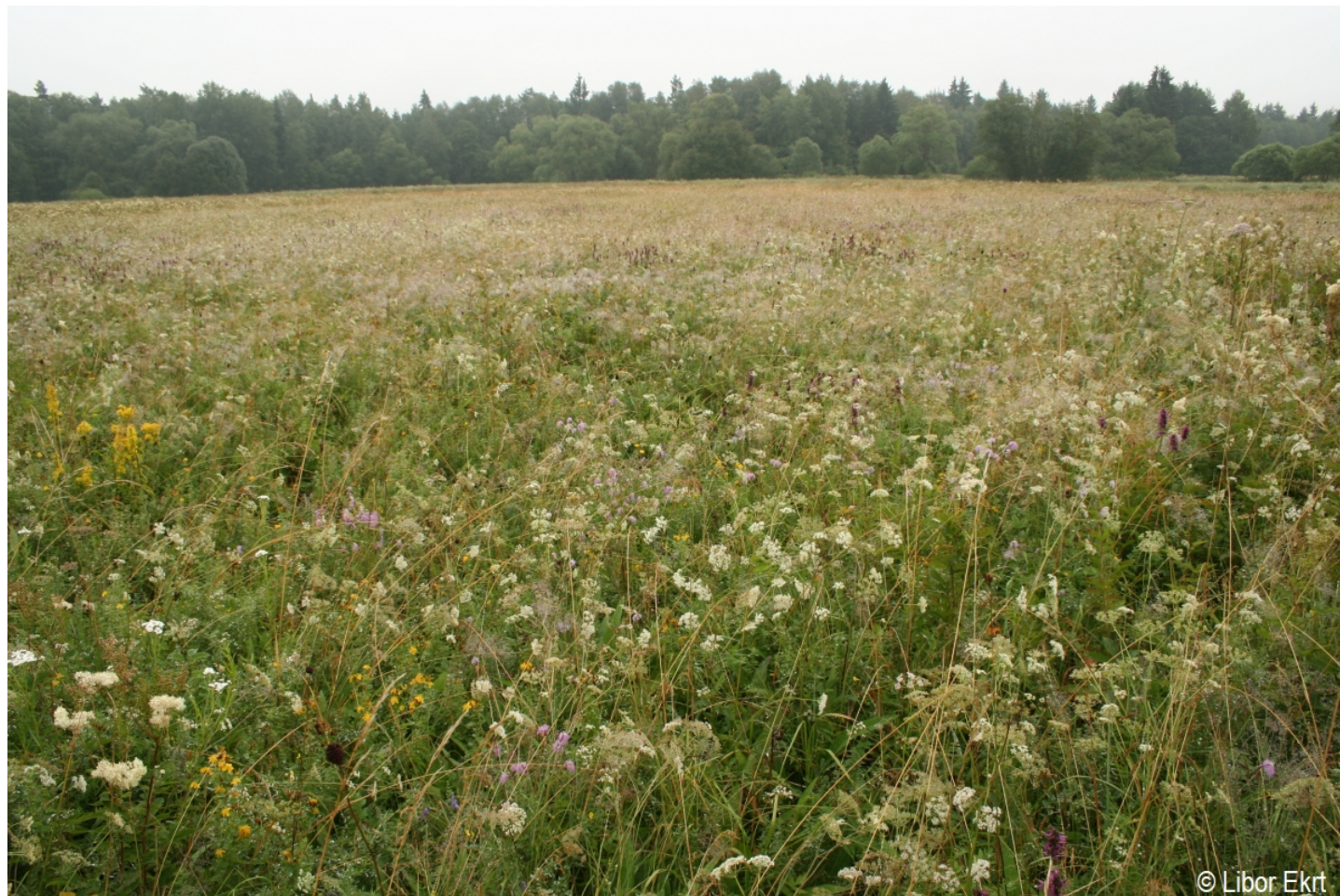
Dianthus superbis – Libor Ekrť – Dobrá.