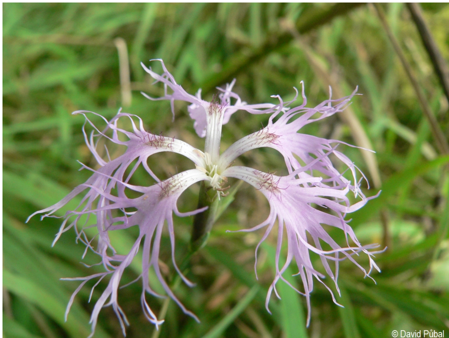
Dianthus superbus – David Půbal – Boletice.