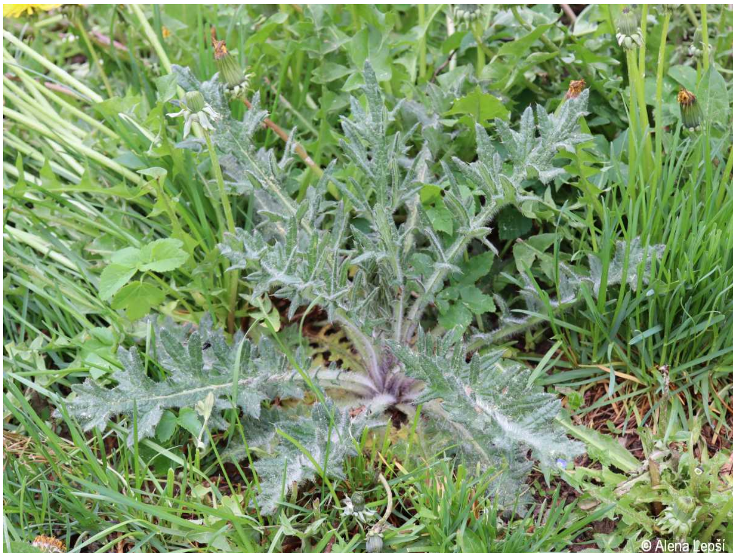
Cirsium vulgare – Alena Lepší – Pěkná.