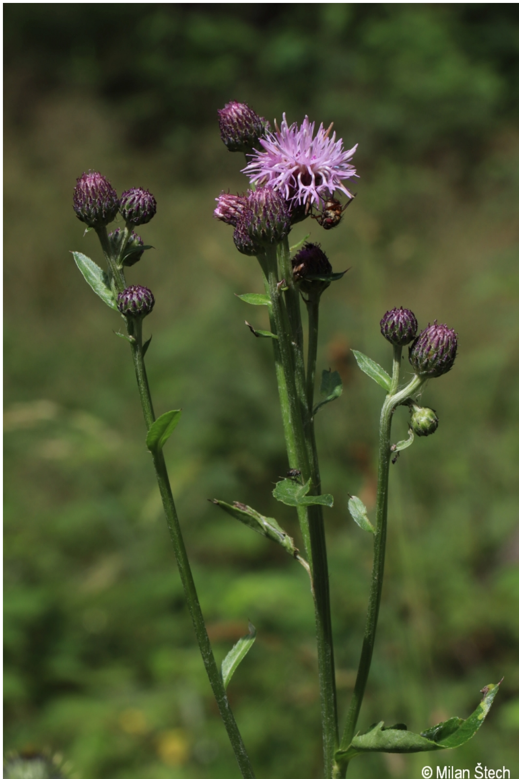
Cirsium arvense – Milan Štech – Bližná.