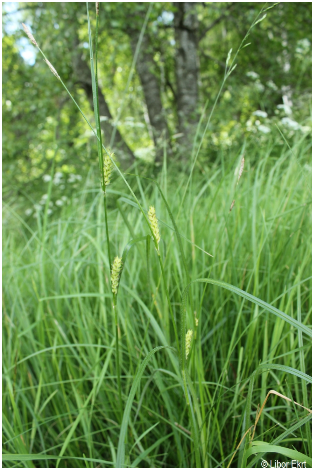
Carex hirta – Libor Ekrt – Hodňov.