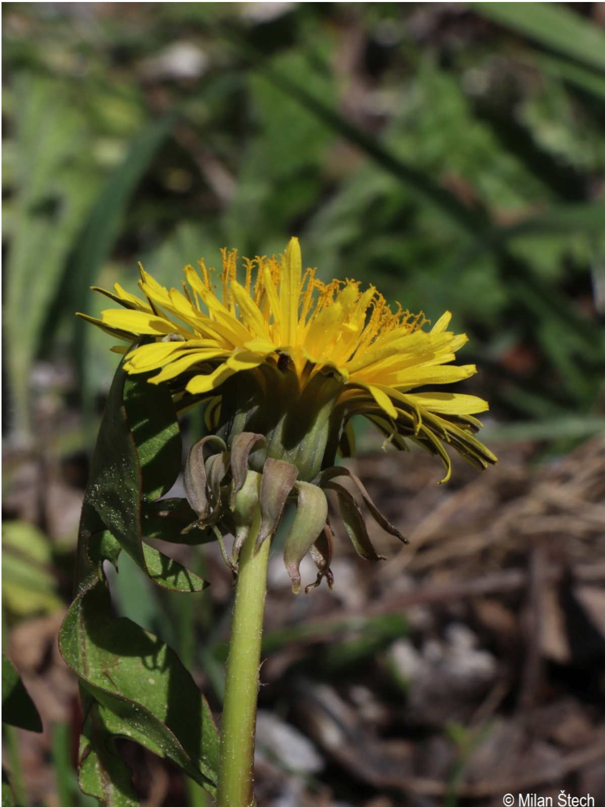
Taraxacum freticola – Milan Štech – Křišťanov.