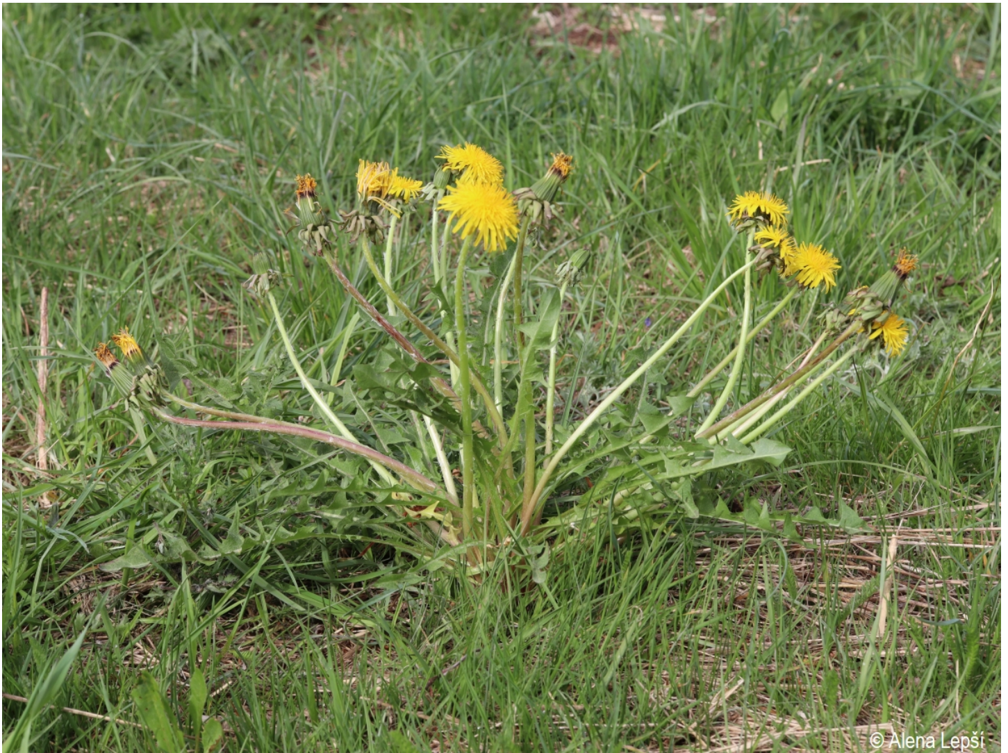
Taraxacum freticola – Alena Lepší – Srní, Mechov.