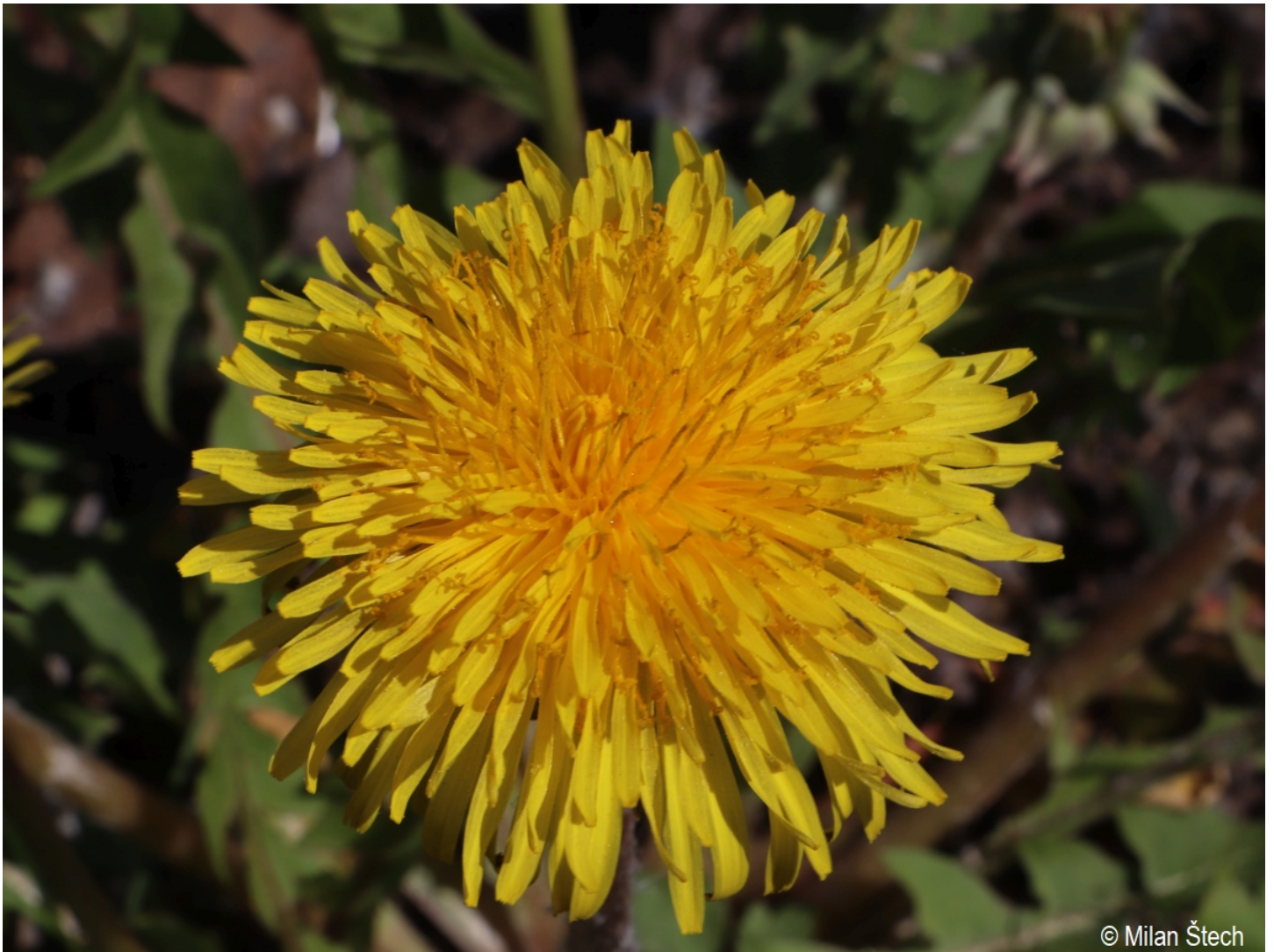
Taraxacum freticola – Milan Štech – Křišťanov.