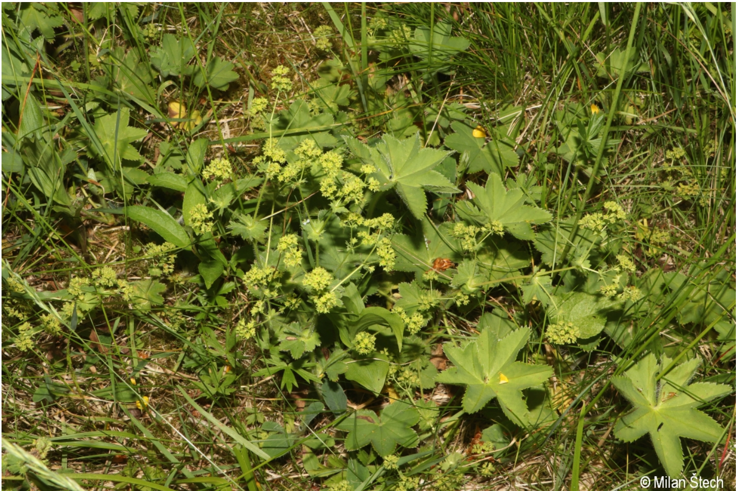
Alchemilla gruneica – Milan Štech – Schöneben.