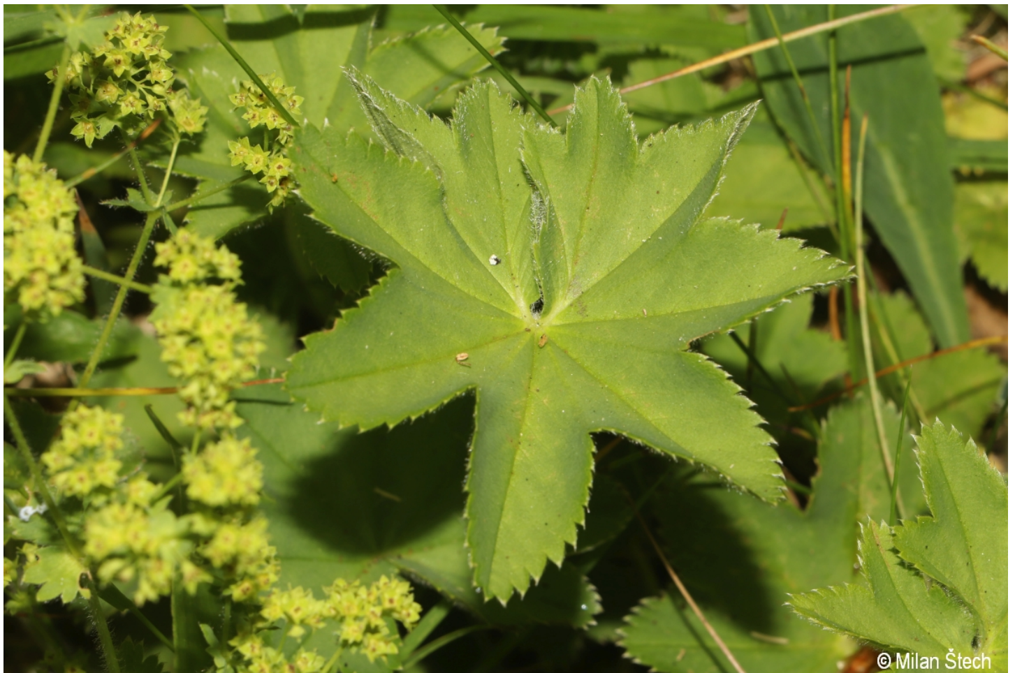
Alchemilla gruneica – Milan Štech – Schöneben.