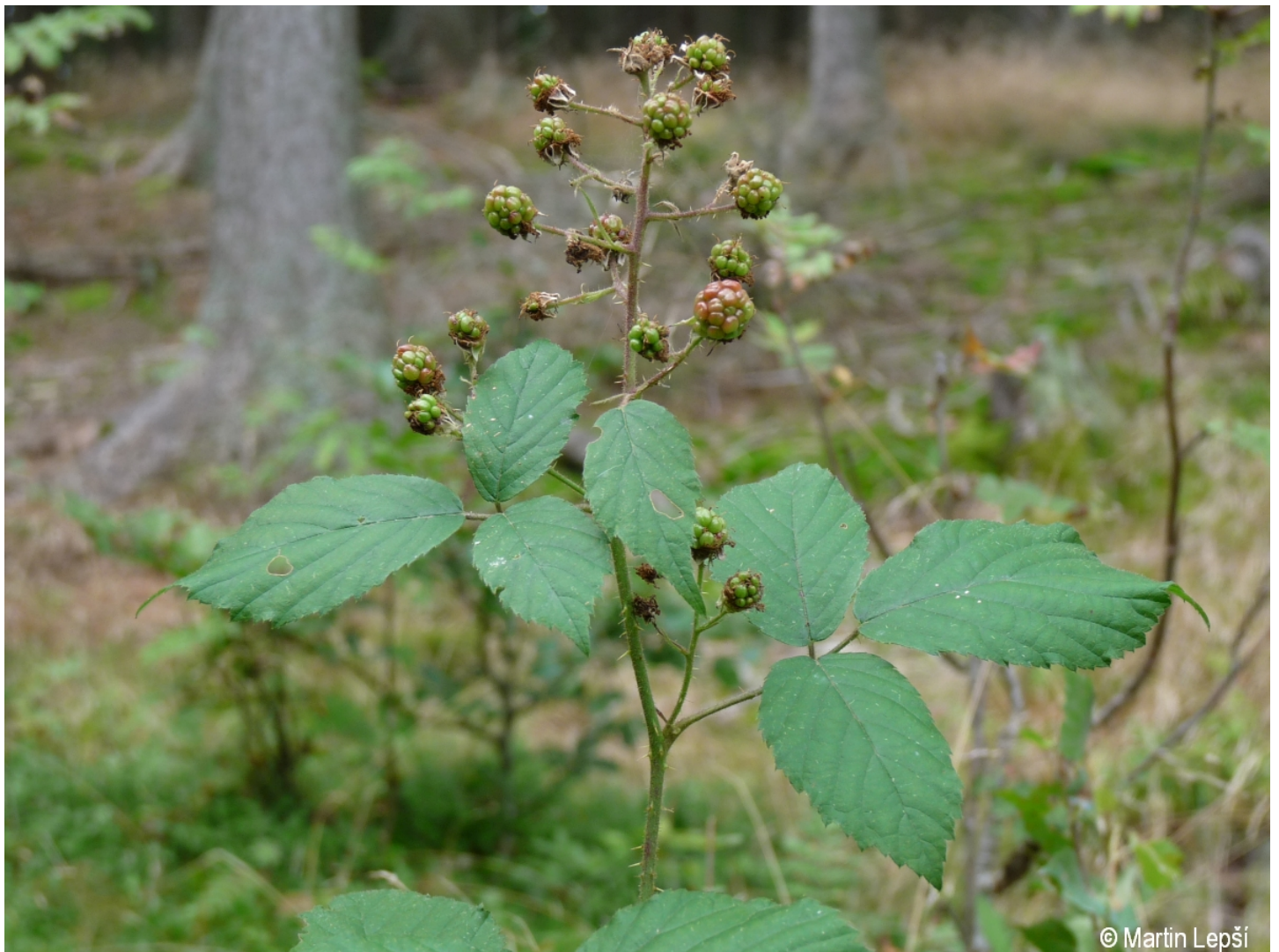
Rubus jarae-cimrmanii – Martin Lepší – Javorník.