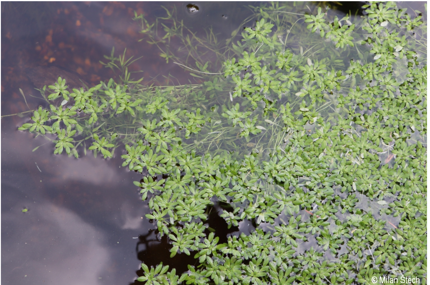
Callitriche hamulata – Milan Štech – Kostelní vrch.