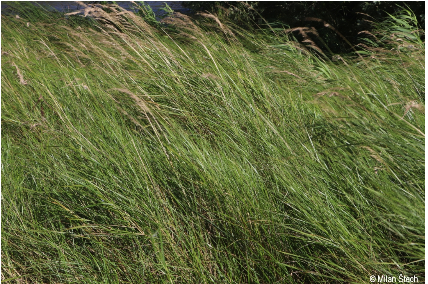
Calamagrostis canescens – Milan Štech – Olšina.