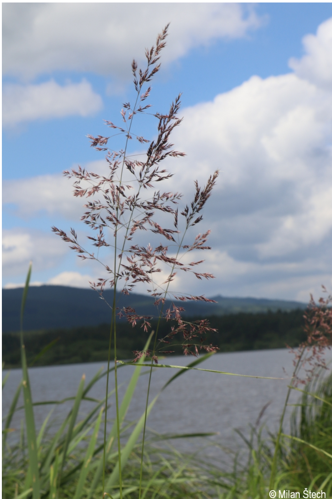
Calamagrostis canescens – Milan Štech – Žlábek.