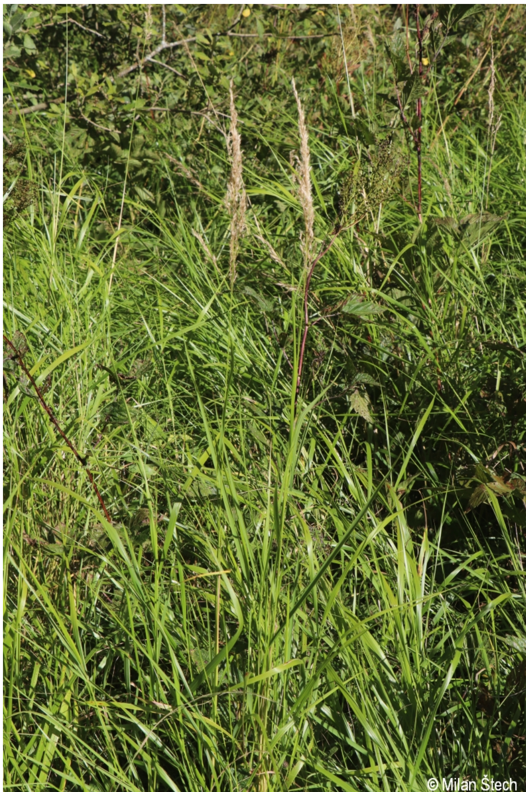
Calamagrostis canescens – Milan Štech – Olšina.