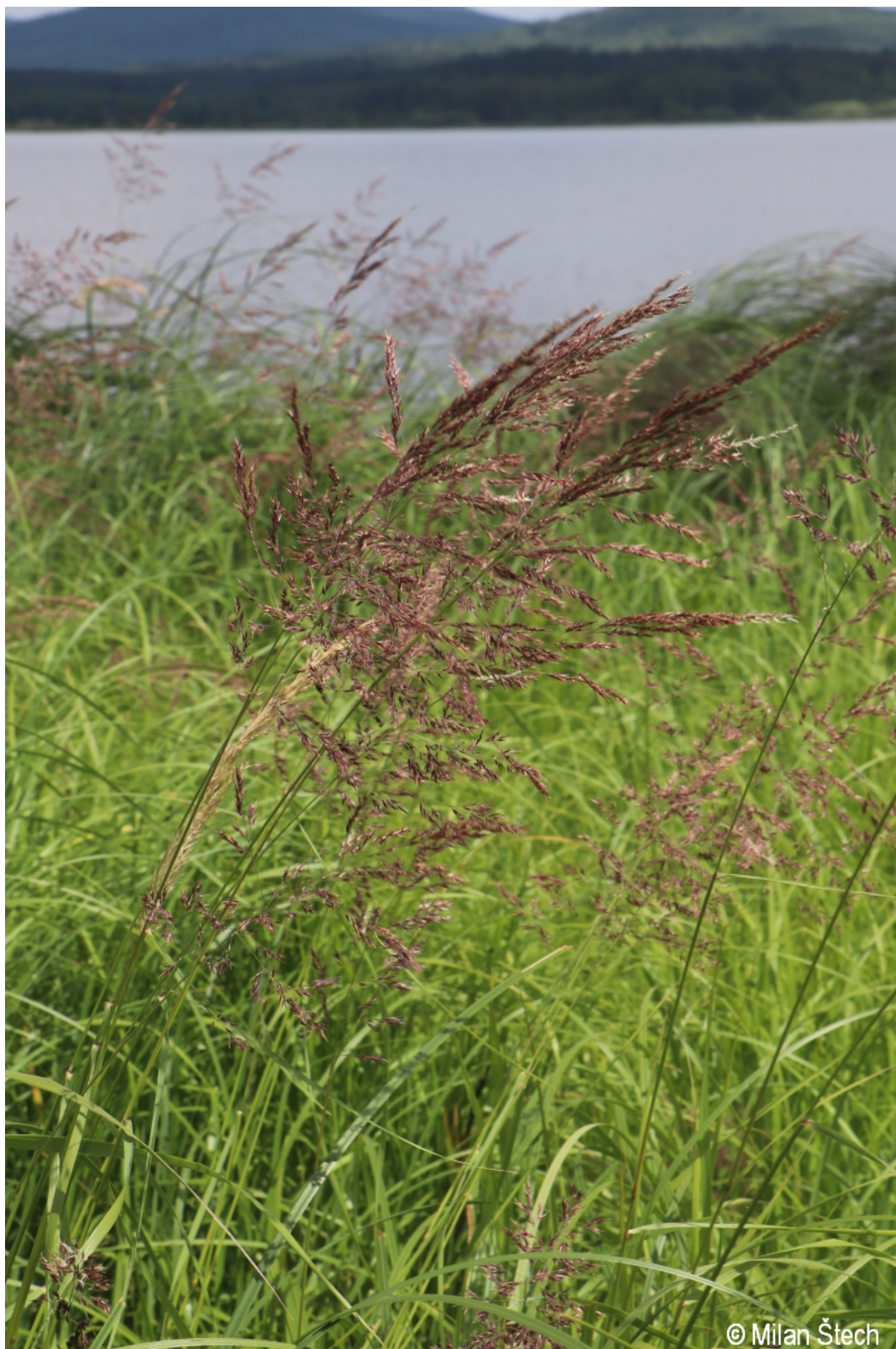
Calamagrostis canescens – Milan Štech – Žlábek.