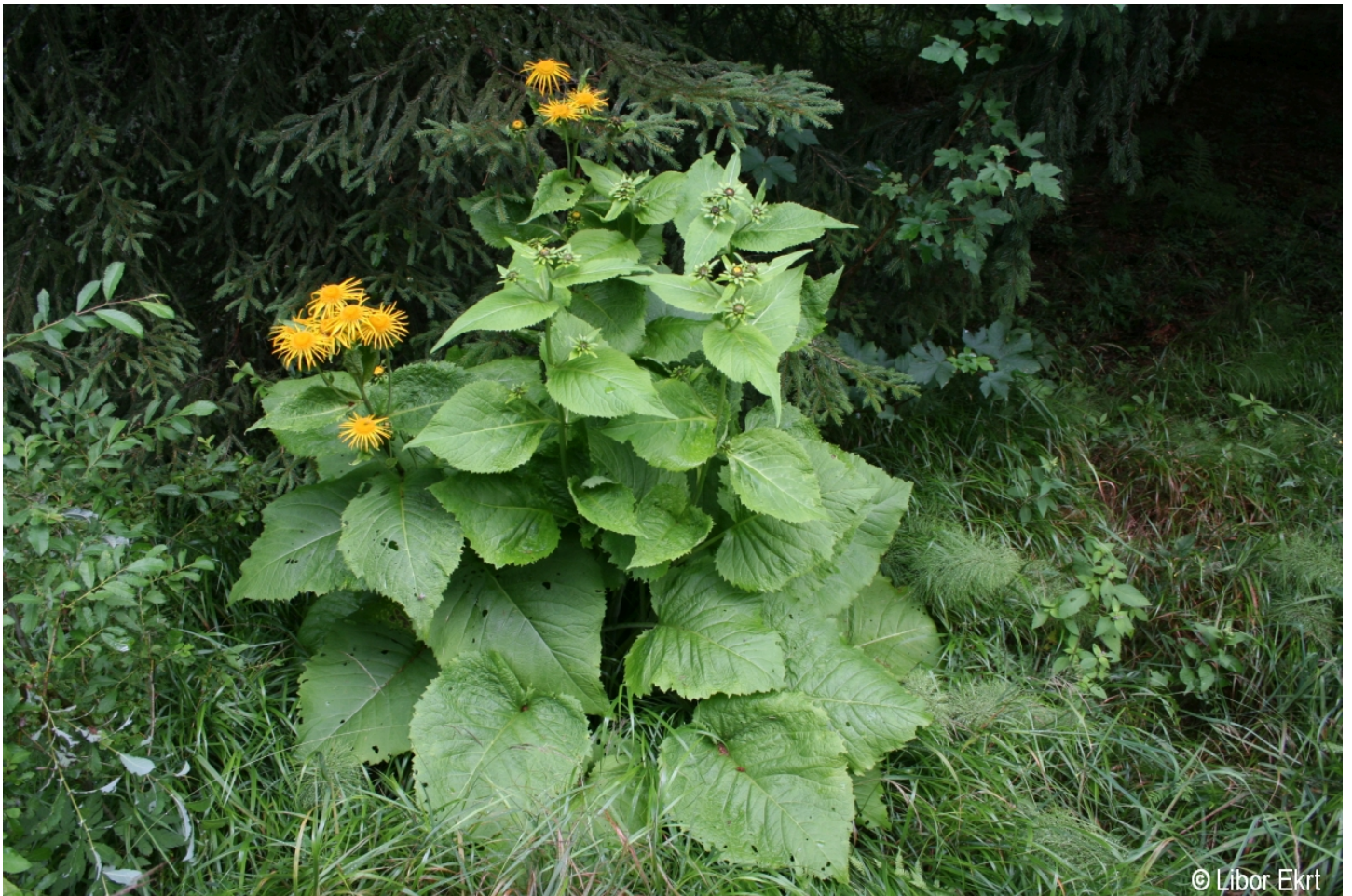
Telekia speciosa – Libor Ekrť – Srní.