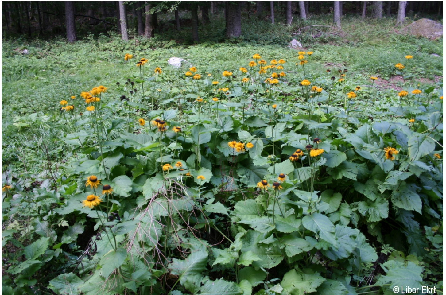
Telekia speciosa – Libor Ekrť – České Žleby.