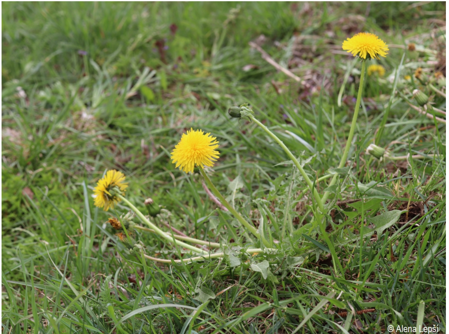
Taraxacum flavostylum – Alena Lepší – Srní, Mechov.