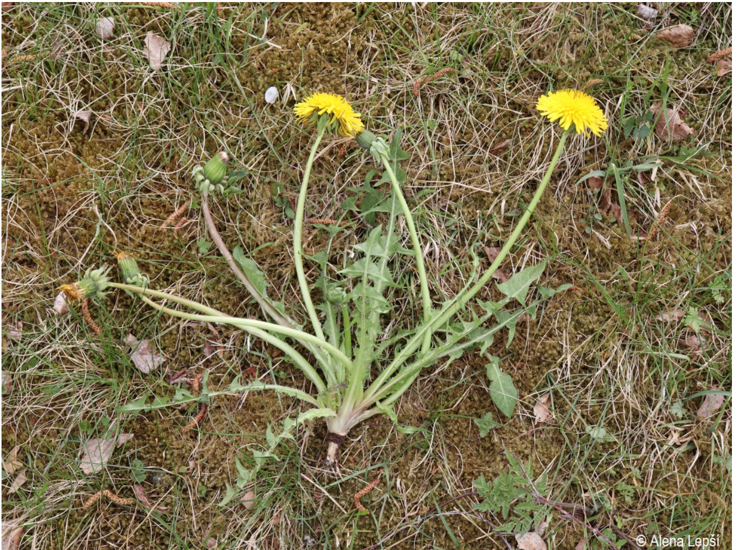
Taraxacum flavostylum – Alena Lepší – Srní, Mechov.