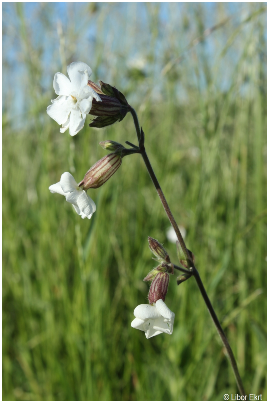
Silene latifolia subsp. alba – Libor Ekrt – Hodňov.