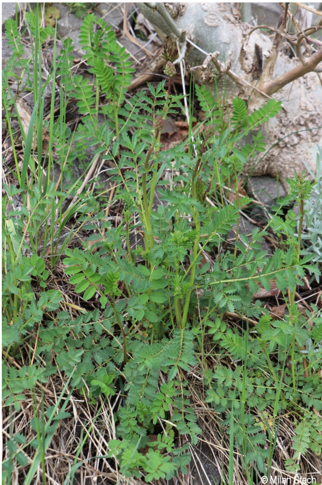
Sanguisorba minor – Milan Štech – Guglöd.