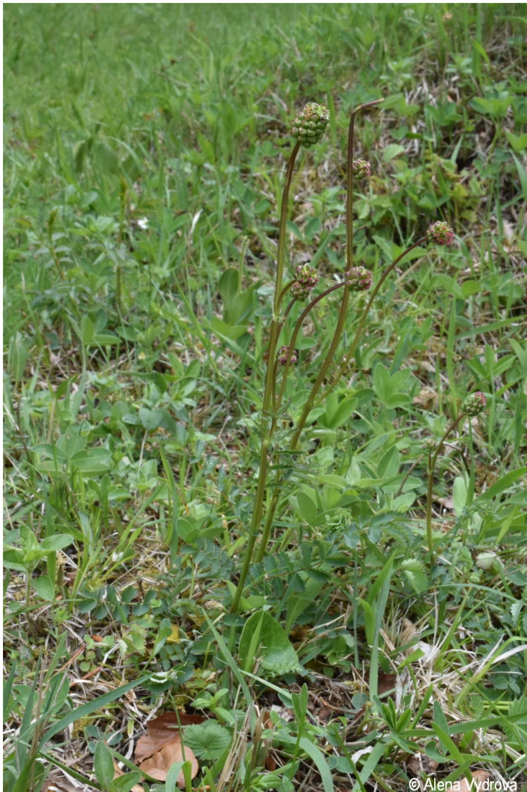
Sanguisorba minor – Alena Vydrová – Milčice, louky nad Divišovským potokem.