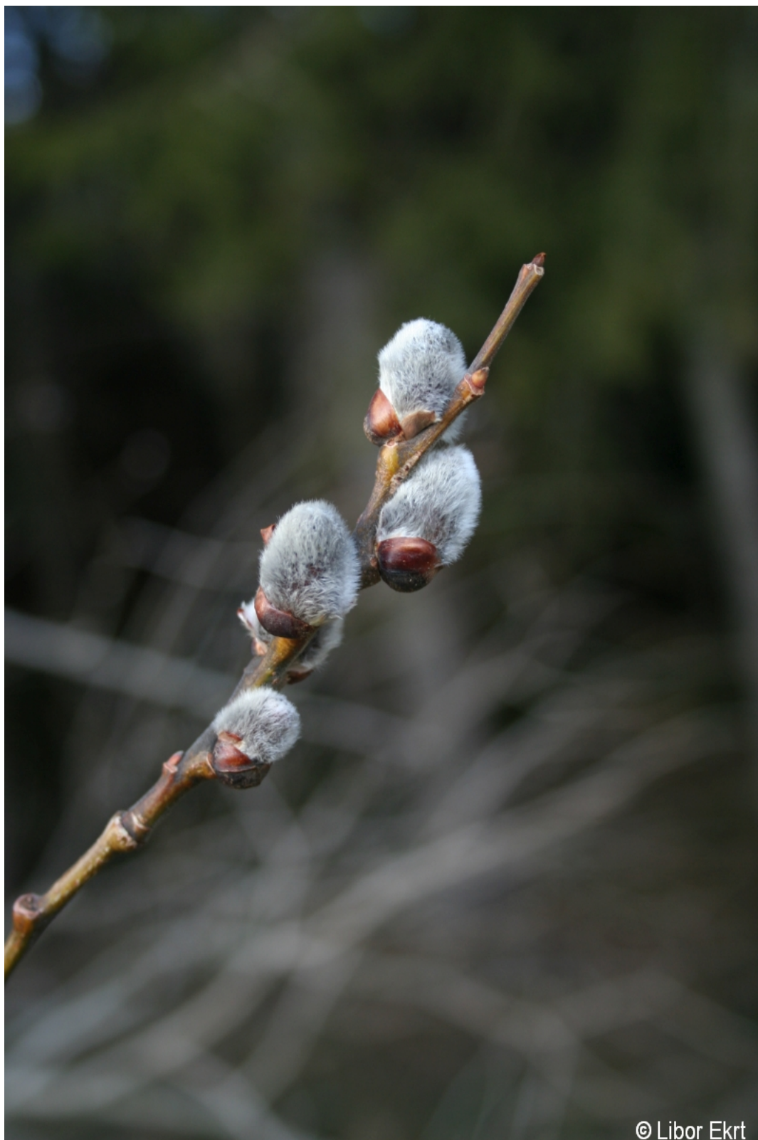
Salix caprea – Libor Ekrť – Vimperk.