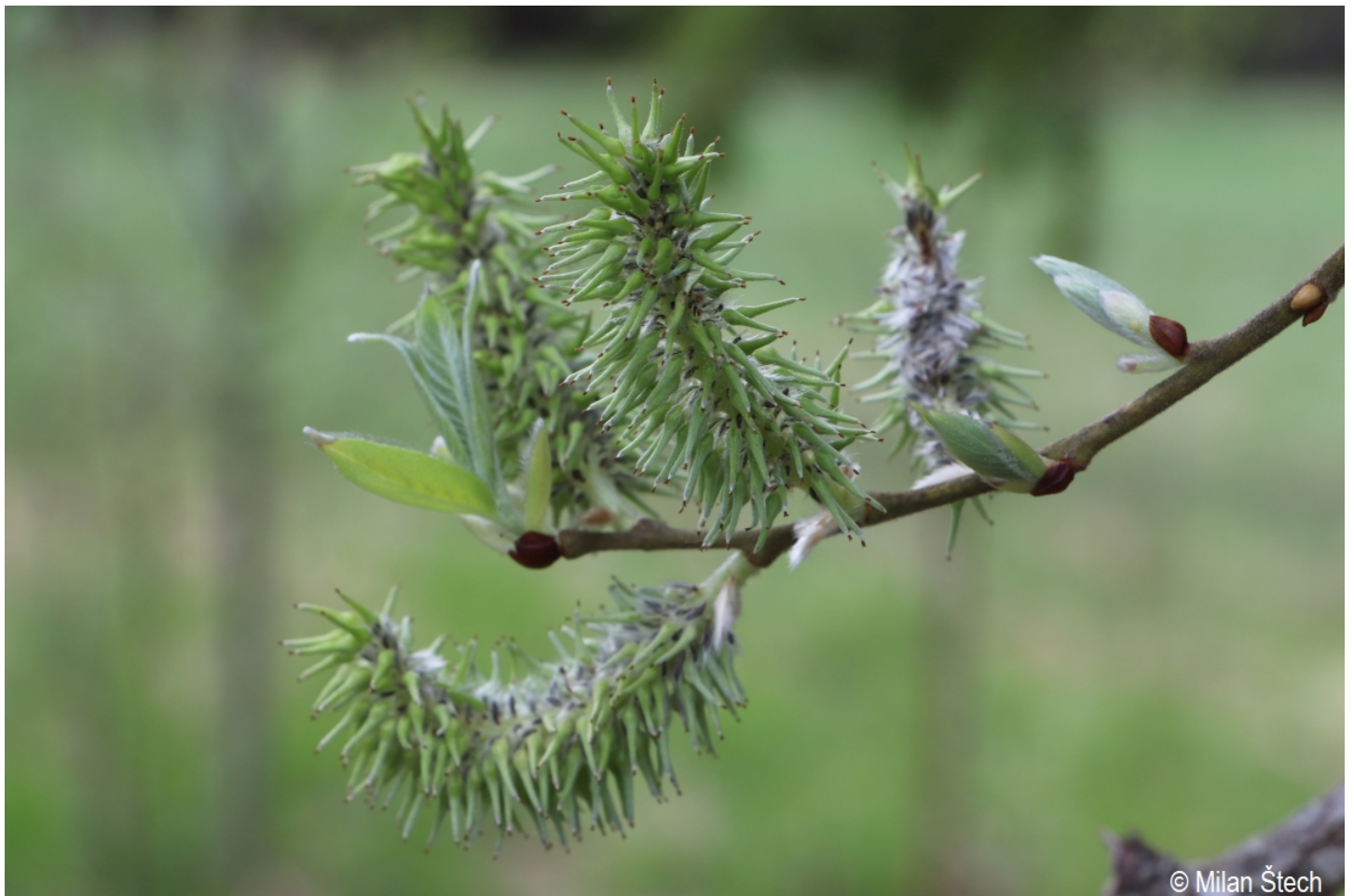
Salix caprea – Milan Štech – Boubín.