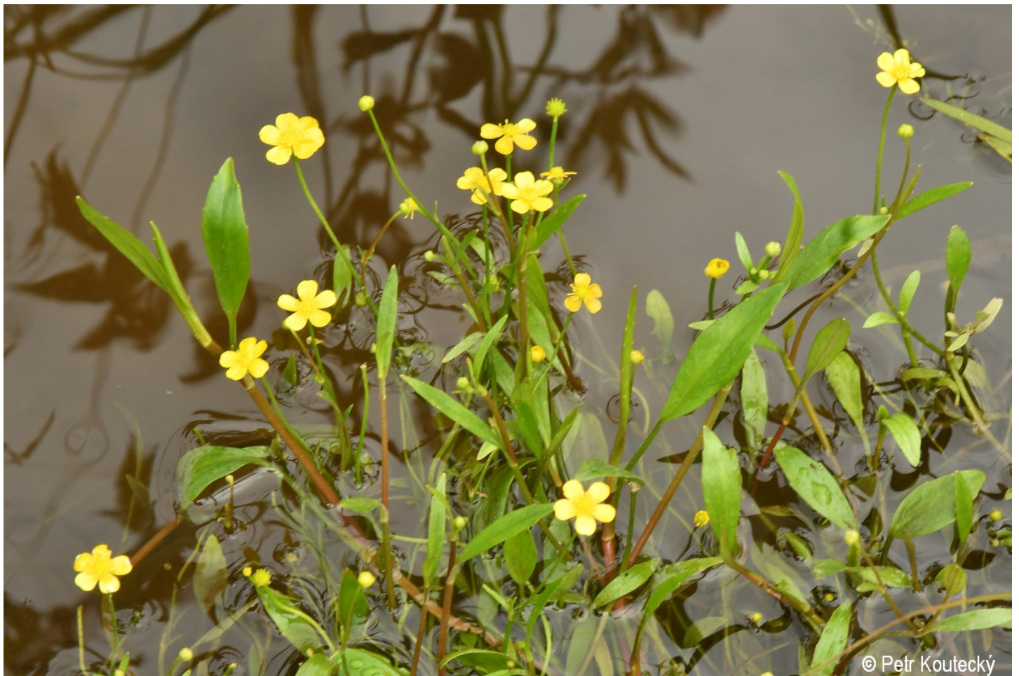
Ranunculus flammula – Petr Koutecký – Dobrá, Vltavský luh.