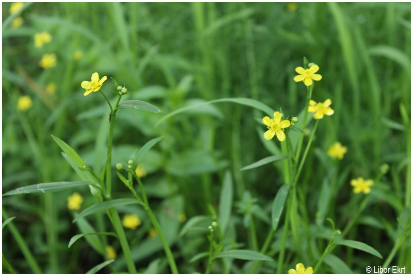
Ranunculus flammula – Libor Ekrt – Házlův kříž.