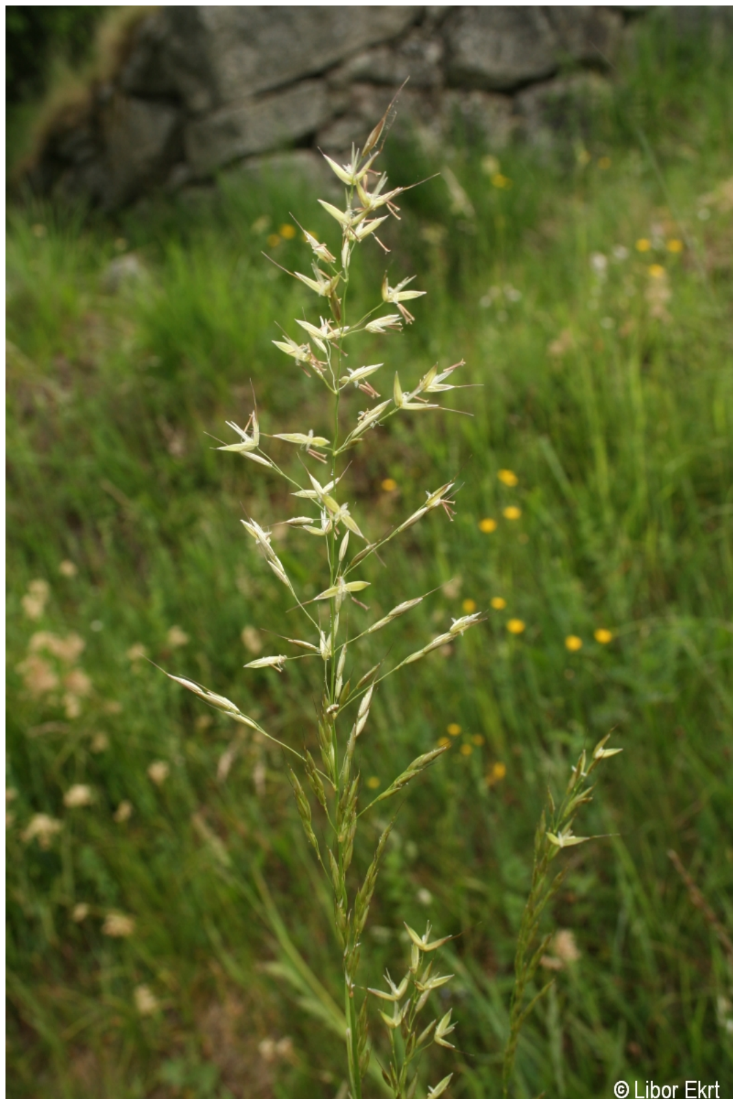
Arrhenatherum elatius – Libor Ekrť – Jelení Vrchy.