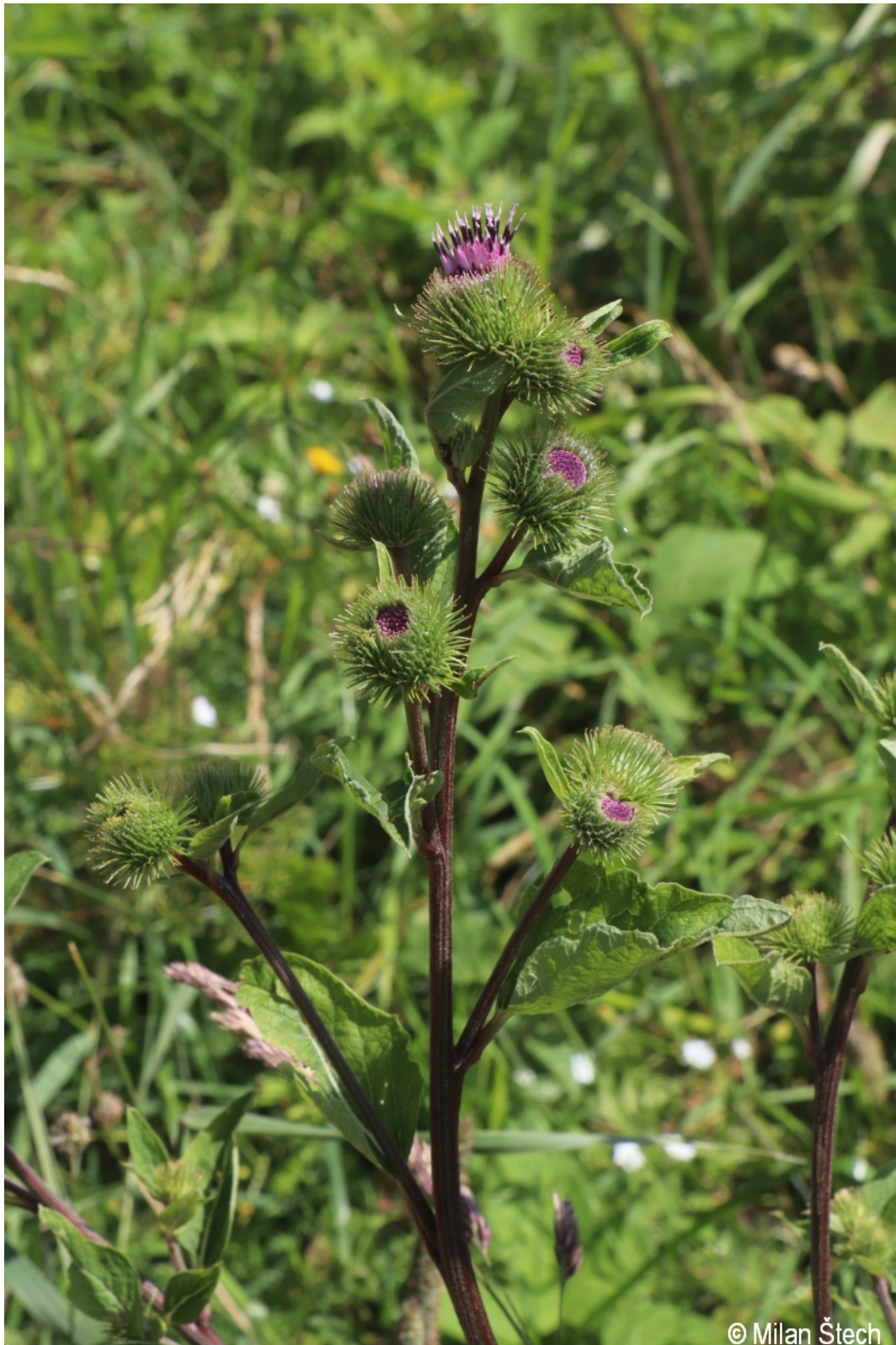
Arctium minus – Milan Štech – Malý Babylon.