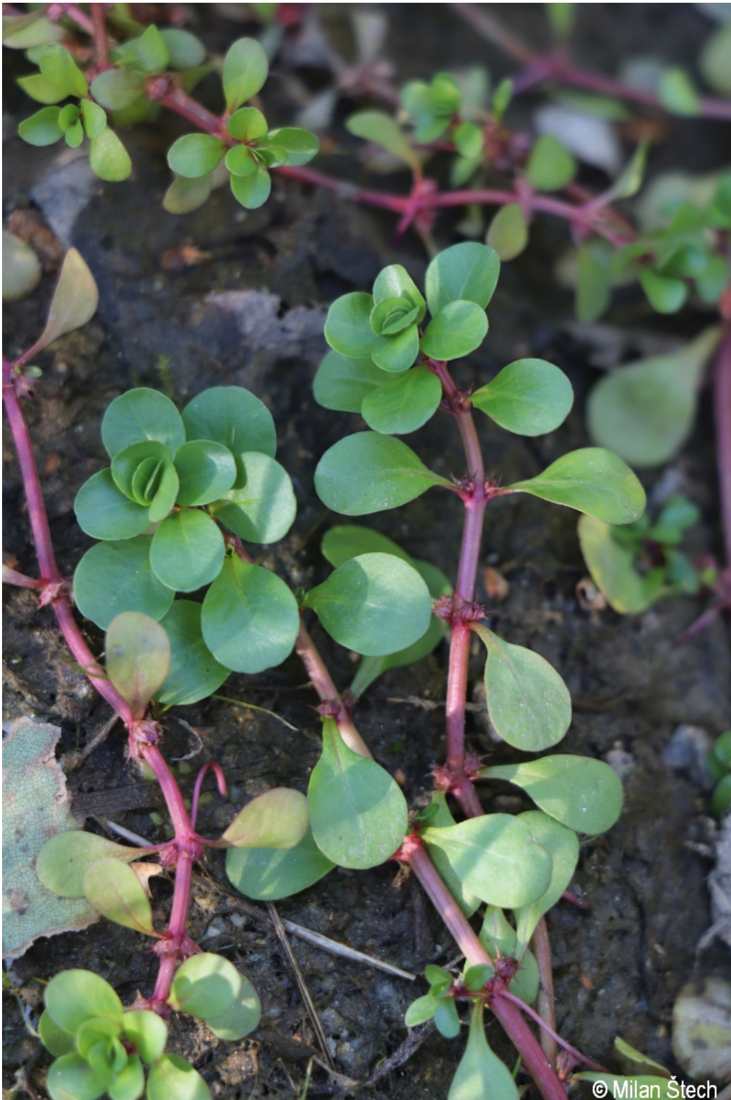
Peplis portula – Milan Štech – Pamferova Huť.