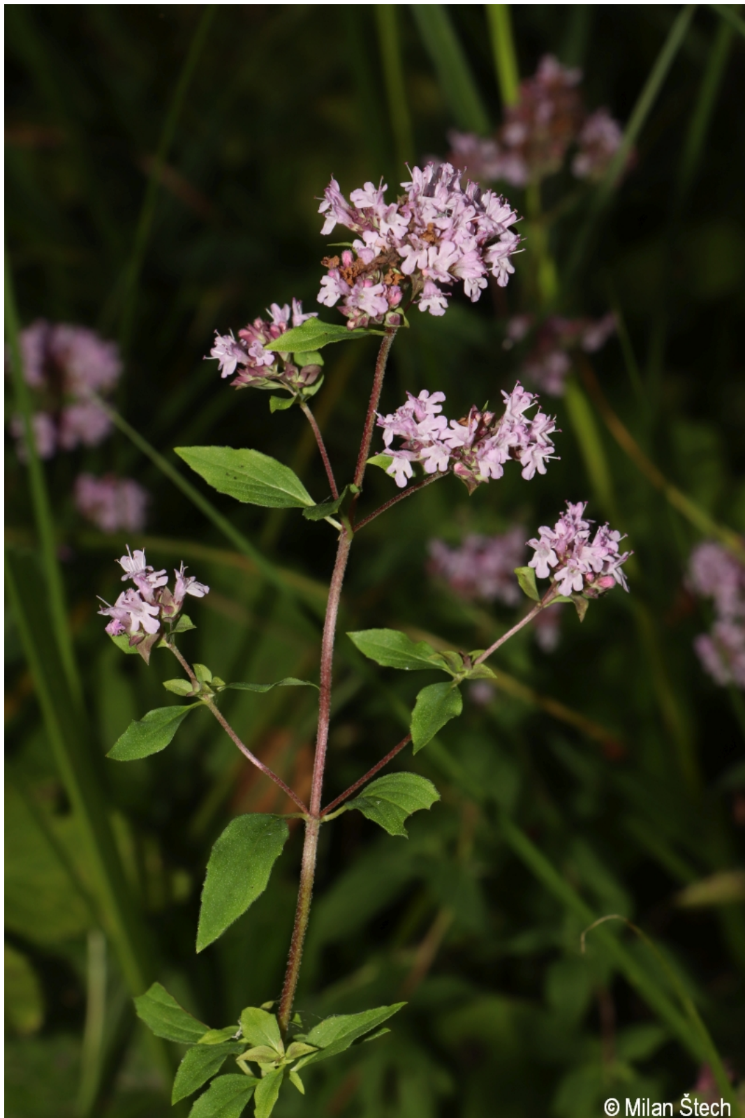
Origanum vulgare – Milan Štech – Olšina.