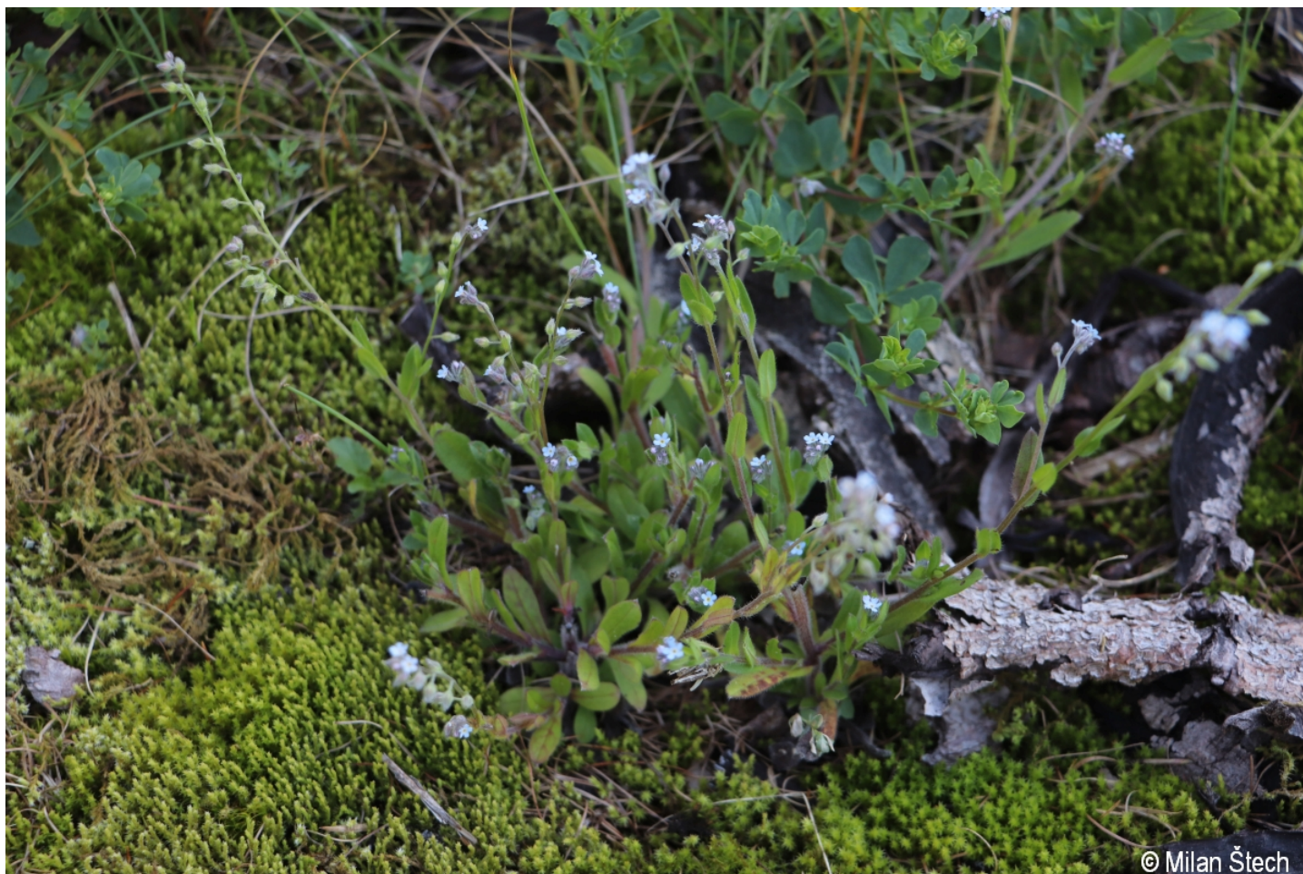
Myosotis arvensis – Milan Štech – Kvilda, Zhůří.