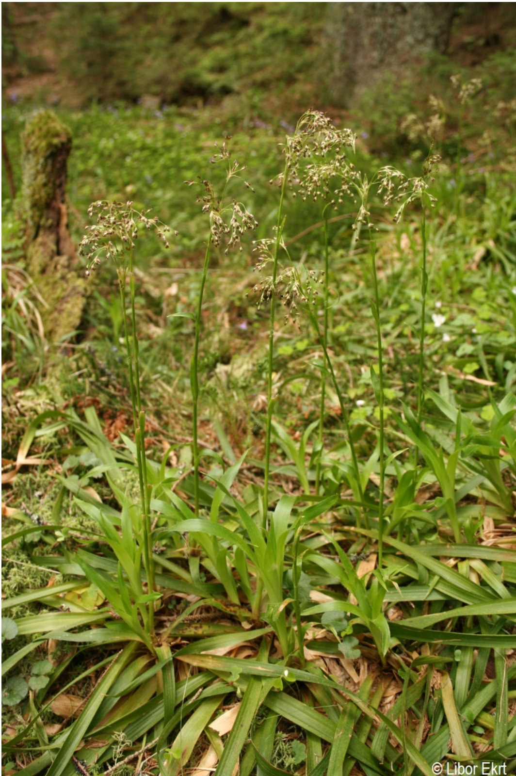
Luzula sylvatica – Libor Ekrť – Popelná.