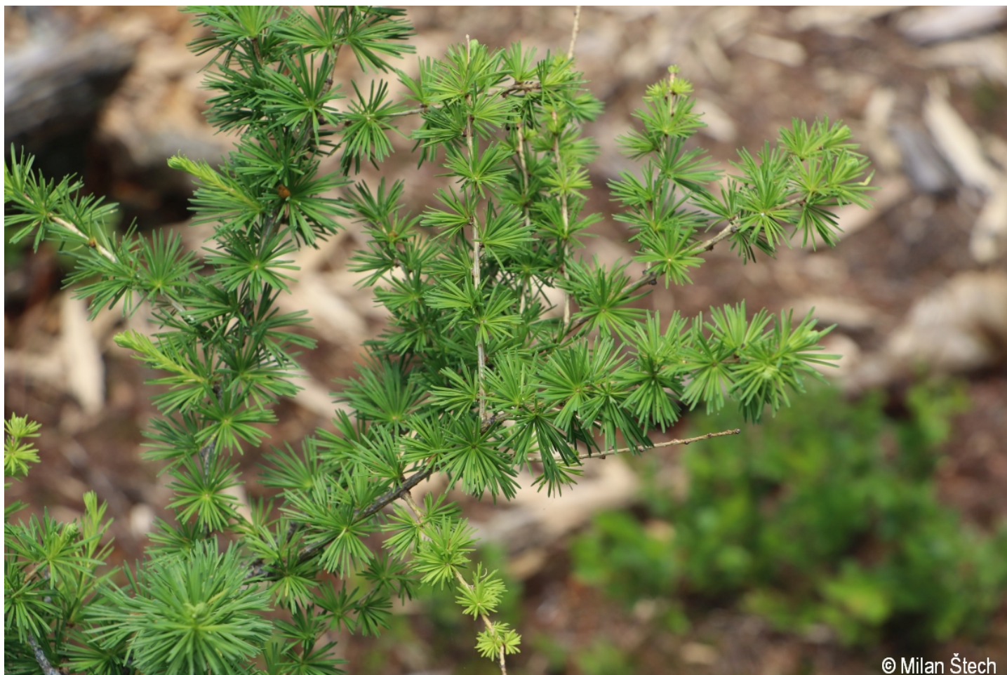
Larix decidua – Milan Štech – Schönbergfelsen.