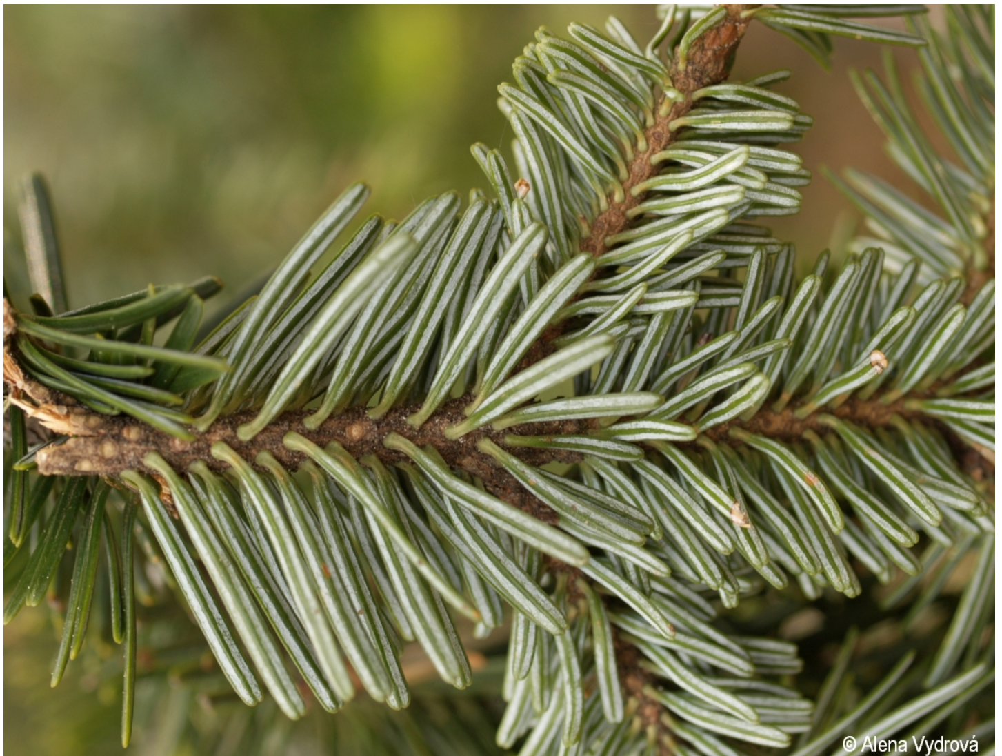
Abies alba – Alena Vydrová – Puchěřský potok.